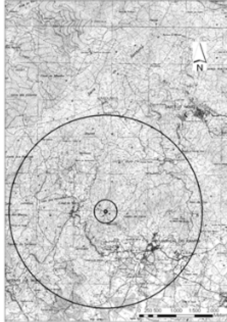
Fig. 3 – Delimitação das áreas de protecção em torno das captações pela aplicação do método do Raio Fixo - Representação das zonas de protecção imediata, intermédia e alargada.

aquíferos porosos homogéneos e procura posterior do tempo de propagação desejado (Fig. 4).