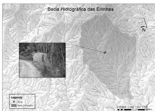
Fig. 2 – Bacia Hidrográfica onde se localizam as captações de água subterrânea das Eirinhas.

A delimitação das áreas de protecção em torno das captações das Eirinhas do Casal da Serra, Freguesia de São Vicente da Beira, Concelho e Distrito de Castelo Branco (Fig.2), pretende garantir a prevenção, redução e controle da qualidade das águas subterrâneas por infiltração de águas superficiais lixiviantes. Foram utilizados, para este efeito, os métodos analíticos de Wyssling e do Raio Fixo (ITGE, 1991).