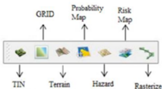
Figura 1: Barra de ferramentas da aplicação

barra de ferramentas todos os procedimentos necessários para a produção de mapas de risco de incêndio florestal, sendo de livre utilização para qualquer utilizador/instituição. Além de ser uma aplicação open source, esta apresenta ainda a vantagem de ser mais rápida e mais fácil de utilizar comparativamente aos software SIG proprietários que, geralmente, necessitam de várias extensões para produzir estes mapas.