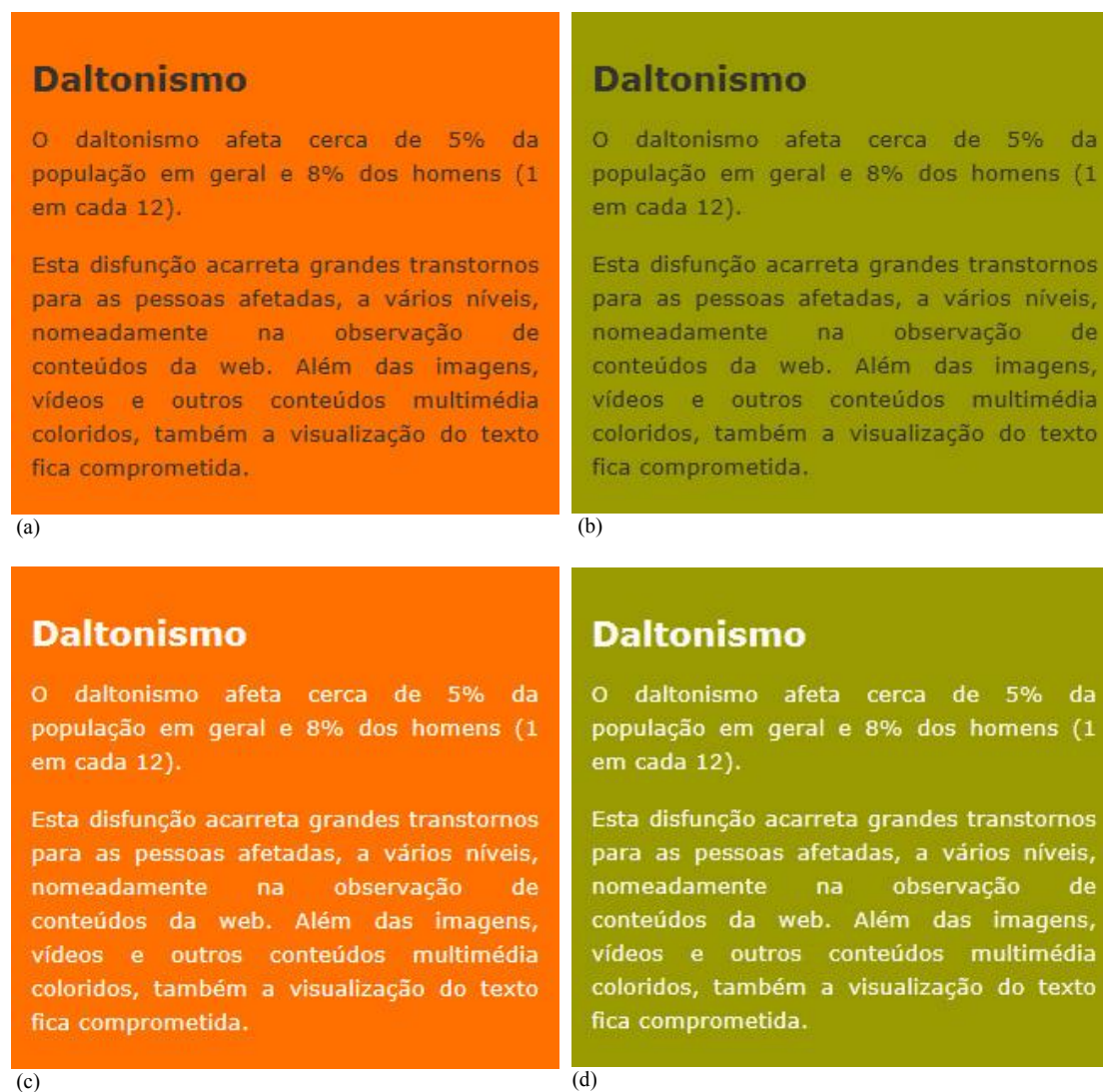
Figura 2 – Aspeto de uma tipografia de cor cinza escuro (#333333) sobre um fundo de cor laranja (#FF7000), (a) aspeto original, visto por uma pessoas com normal visão da cor; (b) aspeto original, visto por uma pessoa com deuteranopia; (c) aspeto depois da adaptação de cor, visto por uma pessoas com normal visão da cor; (d) aspeto depois da adaptação de cor, visto por uma pessoas com deuteranopia. As imagens (b) e (d) foram simuladas por aplicação do método apresentado em (Brettelet al., 1997).

Comparando a legibilidade entre a forma como um deuteranope vê o texto antes (2(b)) e depois (2(d)) da adaptação de cor, é evidente a melhoria na comodidade de leitura.