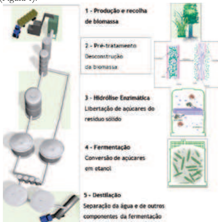
Figura 1 – Etapas na produção de etanol de 2ª geração

A produção de etanol por métodos bioquímicos baseia-se na aplicação de um conjunto de processos de extracção, separação e de conversão biológica dos componentes elementares da biomassa como meio de produzir biocombustíveis, bioprodutos e bioenergia. Os processos utilizados na plataforma bioquímica têm o objectivo de extrair os açúcares simples existentes nos componentes principais dos materiais lenhocelulósicos (celulose, hemiceluloses e lenhina) através da quebra das estruturas polimerizadas da celulose e da hemicelulose seguida do posterior processo fermentativo, no qual através da acção de alguns microorganismos o açúcar é convertido em etanol (Figura 1).