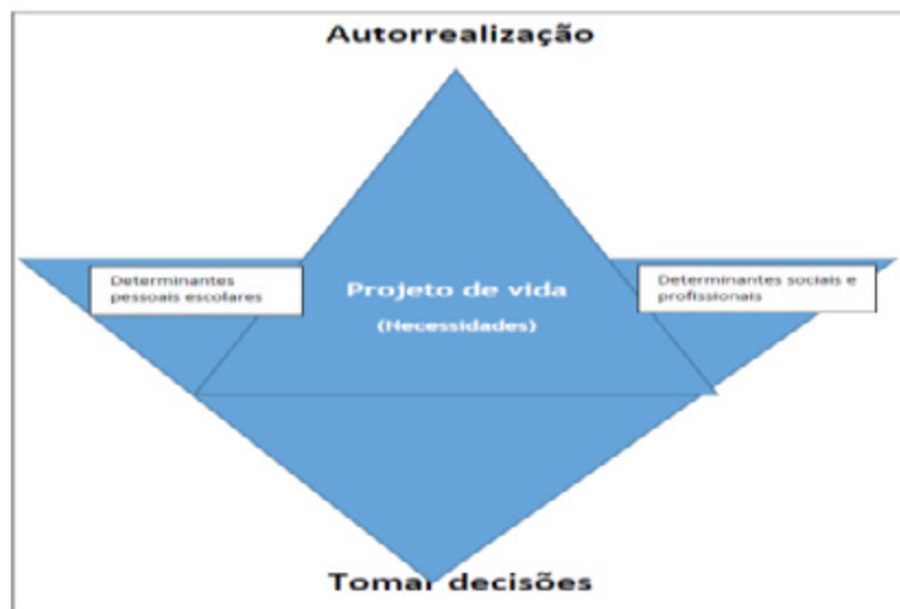
Figura 2: O cruzamento de triângulos na Visão Holística de Orientação

Os técnicos e/ou professores executores do programa devem trabalhar diretamente com os alunos, tendo como objetivos: combater o insucesso e abandono precoce; promover ofertas de formação de dupla certificação; valorizar o ensino técnico não superior, os cursos profissionais e de qualificação; promover a empregabilidade; incrementar igualdade de oportunidades; desenvolver na prática a orientação pessoal, escolar e profissional (aluno a tomar decisões adequadas). As suas estratégias de intervenção realizam-se a dois níveis de exploração: interno, ou self insight e externo, de otimização da experiência prática. Portanto, devem assessorar os alunos na descoberta da sua vocação e/ou profissão, pois essa escolha implica estar consciente de vários fatores (BROWN; LENT, 2005). Nesse sentido, a orientação apoia e aconselha o aluno. A intervenção (escolar e social) deve efetuar-se: no contexto educacional, organizacional e ocupacional, nos tempos livres, atividades comunitárias e intergeracionais. O aluno deve tomar consciência do Projeto Escolar e Profissional conhecendo seus interesses, necessidades e capacidades. Essa intervenção facilitará a cooperação (escola, família, empresas, entidades sociais), as relações entre a formação e o desenvolvimento dos alunos, o empreendedorismo e o apoio às iniciativas juvenis.