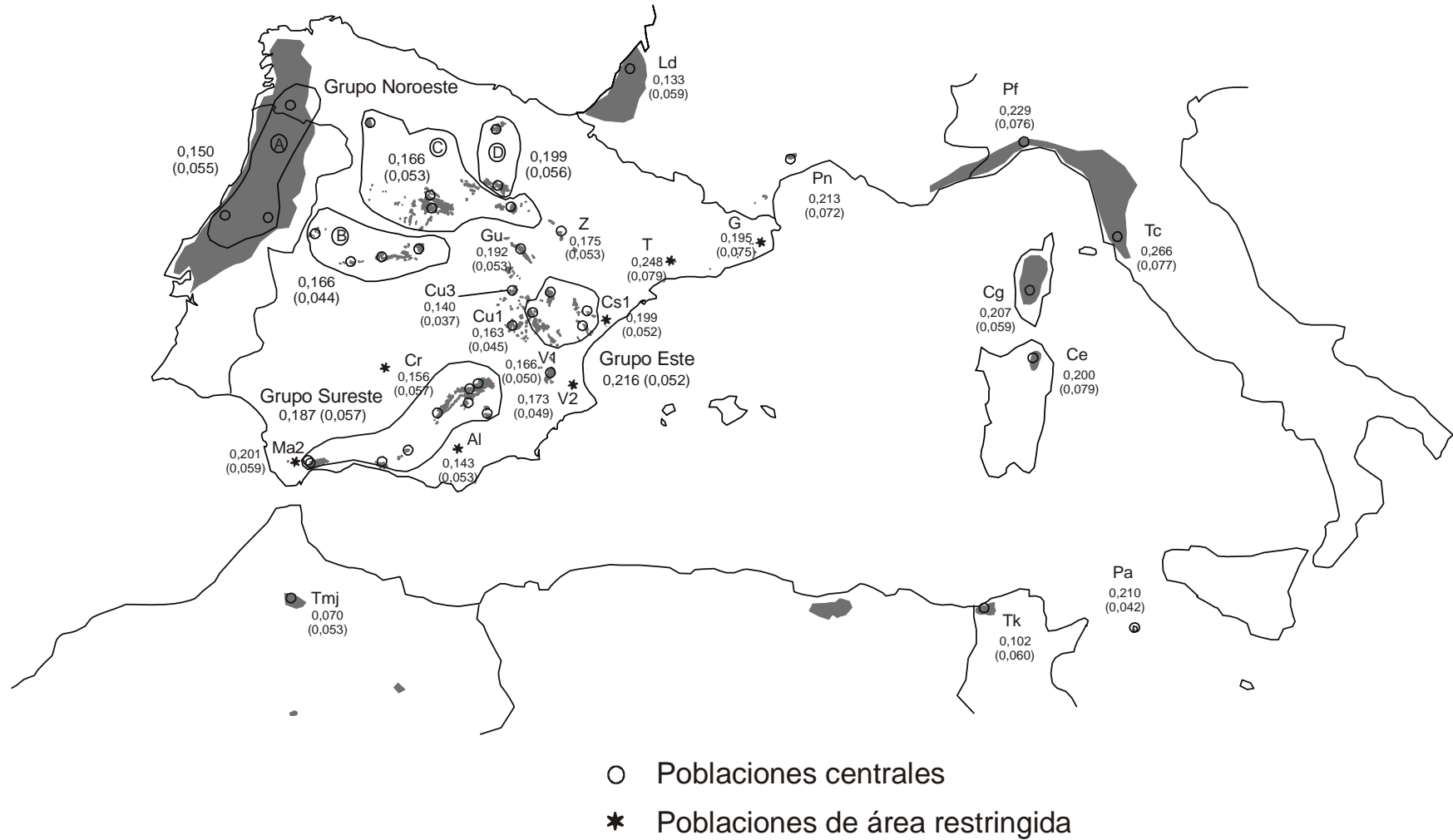
Figura 1. Distribución de la diversidad genética de P. pinaster ( H_e ) en el área de distribución de la especie con 8 loci isoenzimáticos. Entre paréntesis el error estándar.