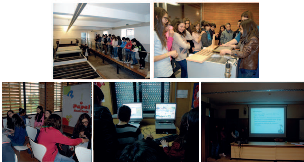
Imagem 2: Atividades da sequência didática realizadas pelos alunos do grupo II.

É notório nas imagens o interesse dos alunos nas diferentes atividades desenvolvidas.