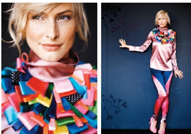
Figura 3: Fotografia do catálogo da coleção.

Nessa sessão, é apresentado todo o acervo digital das coleções da marca. A categoria é composta por dez coleções. Elas são apresentadas, na tela inicial, em listagem cronológica. Entretanto, o nome não explicita o ano e estação, como no menu inicial, mas sim o nome da coleção. As coleções do acervo são: Mind Games (Jogos da mente, em inglês), Ein Sommernachtstraum (Um sonho de uma noite de verão, em alemão), Jolie Jumper (Jolie Saltitante, em inglês), Sunny Side Up (O lado ensolarado para cima, em inglês), White Rabbit (Coelho branco, em inglês), Lucy in the Sky (em alusão a música dos Beatles), Sweet and Twinsets (doces e twinsets), Gipsy's (Boêmio ou cigano, em inglês), Kapstadt (Cidade do Cabo, em alemão) e Debut (Estréia, em inglês ou alemão).