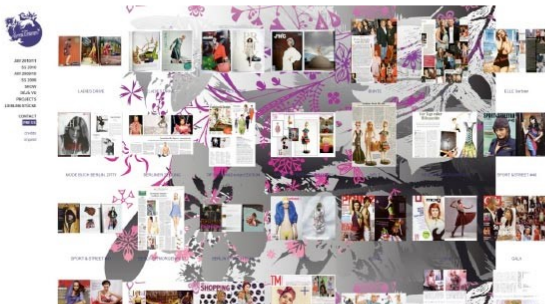
Figura 5: Opção Press no Menu do site Smeiliner.

Ao seleccionar a opção Press no menu, abre-se, na mesma janela, um novo plano de fundo com imagens de publicações onde a marca foi citada ou exposta. No total, são apresentadas 30 aparições da marca em revistas especializadas ou destinadas ao público interessado. A exibição das publicações dá-se através da cópia da imagem original da publicação, posicionado acima do nome da revista em que foi divulgada.