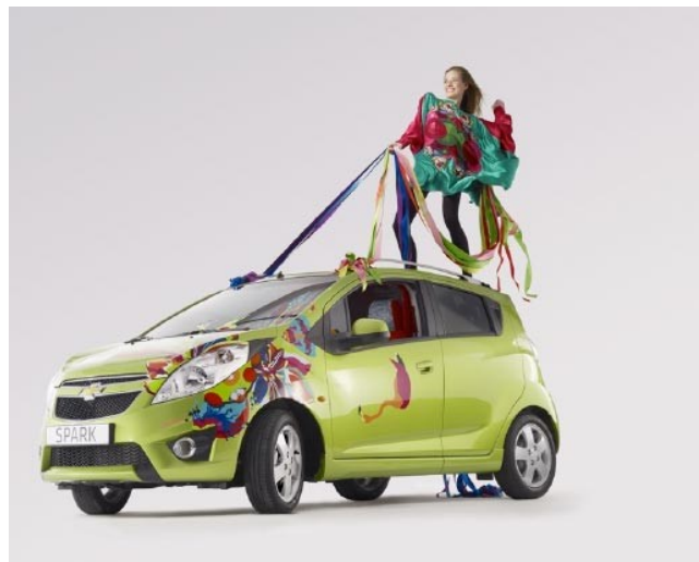
Figura 4: Intervenção de exterior e interior pela marca Smeiliner no lançamento do carro Spark da Chevrolet, em estratégia de co-branding.

Em Projects , são apresentados os projetos com os quais a marca já esteve envolvida. Entre eles, estão: o 50º aniversário da boneca Barbie, Chevrolet Spark , a peça interventiva Territories , a instalação Fleet in Being e o case para Ipod , denominado Magic Jewel e criado em conjunto com a marca Gravis .