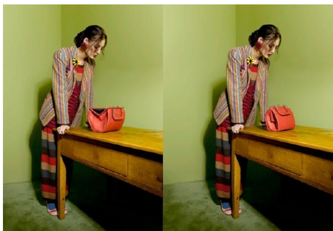
Figura 2: Snaps do movimento nas fotografias.

Ao aceder a cada uma das coleções, o fundo da tela é trocado por grafismos correspondentes ao tema da coleção visitada. No caso da coleção AW 2010/11, a mais recentemente apresentada no sítio, o tema da coleção intitula-se Birds. Não há apresentação de release que elucide a temática do projeto de moda ou outras informações relevantes. A informação disponível é totalmente emitida através de imagens.