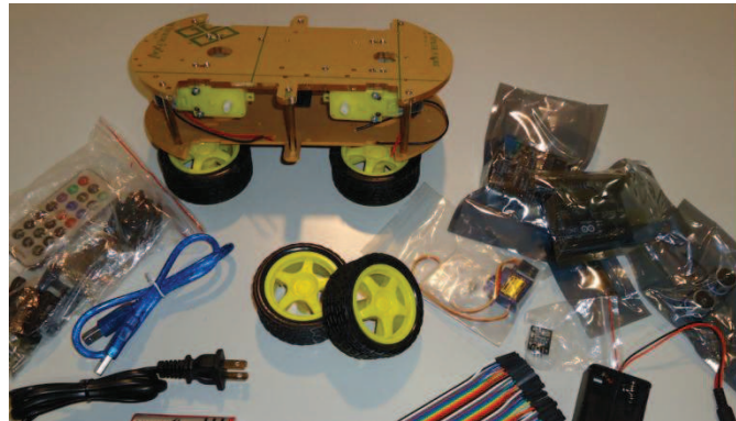
Figura 3: Componentes do kit robótico.

engenharia e tecnologia, pois inclui tutoriais especialmente desenhados para o efeito. Estes encontram-se no site do projeto ( escoladerobotica.ipcb.pt ).