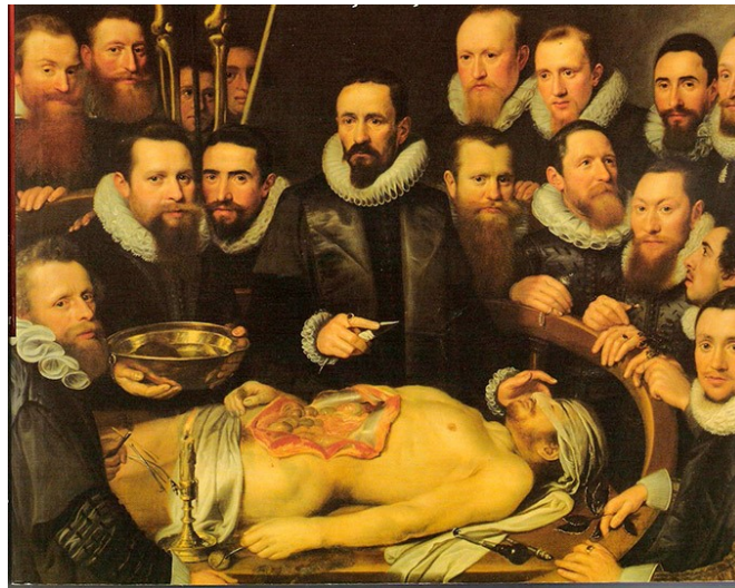
Fig.1 – Lição de anatomia do Dr. Van der Meer. Quadro de Van Mierevelt, 1617, Museu de Delft (REZENDE, 2006).

No livro “A Vida e Obra de Semmelweis”, escrito pelo romancista francês Louis Ferdinand, narra que as batas eram de cor escura e que quanto mais manchadas de sangue tivesse um avental, mais respeitado seria o profissional pela comunidade, indicando muitos feitos na profissão. Pode ler-se na obra: “A partir de hoje, 15 de Maio de 1847, todo o estudante ou médico é obrigado, antes de entrar nas salas da clínica (...), a lavar as mãos, com uma solução de ácido clórico, na bacia colocada na entrada (...) e será também obrigado o vestir roupa adequado ao trabalho. Esta disposição vigorará para todos, sem exceção” (REZENDE, 2006).