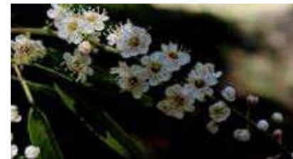
Fig. 2 - Aspetto geral das inflorescências de azereiro (Ribeiro, S. 2015)

O azereiro é utilizado como elemento decorativo em jardins e espaços verdes em especial devido à beleza das suas flores exuberantes e da sua folhagem perene e brilhante. Para preservação da biodiversidade pode ser efetuada a sua propagação por via seminal sendo este o método mais utilizado e com êxito em viveiro (Labajos e Blanco, 1992). Uma alternativa à propagação sexuada, ou por semente, é a sua propagação por estacas terminais que, segundo Ribeiro e Antunes (1997) diminui o período de juvenilidade das plantas, requerendo, porém, a utilização de auxinas, para uma percentagem de enraizamento, após 3 meses de 70%. Esta técnica também permite a obtenção de plantas para serem utilizadas fora do seu habitat natural, no qual devem ser preservadas.