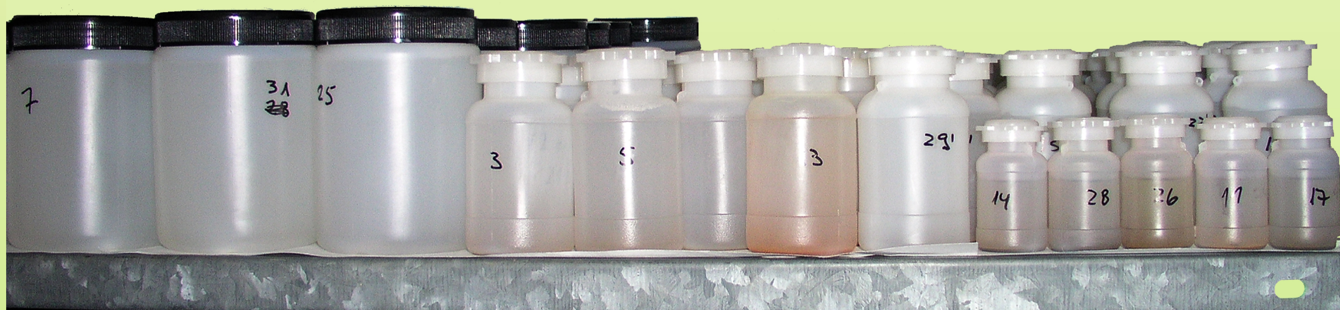
Águas superficiais 1:10000

Efectuou-se um ensaio de desorção de fósforo em meio aquoso. Para tal utilizaram-se três relações solo:solução - 1:10000, 1:1000 e 1:100 simulando o que poderá ocorrer na transferência de P do solo para as águas superficiais, de escoamento superficial e de drenagem interna respectivamente.