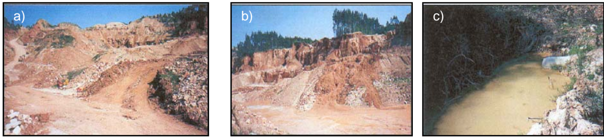
Fig. 2. Alguns impactes associados a pedreiras em actividade. a) Acumulação de detritos de exploração; b) deslizamento de materiais; c) descarga de efluentes na Ribeira de Olho da Giota

Nas pedreiras aterradas existentes na área estudada, pode ser refira a existência de extensas áreas de solo nu, desprovido de vegetação, ou em quantidade reduzida, que incrementa o processo de erosão dos solos (Fig. 3). Nesta situação, o impacte visual é bastante elevado provocado, sobretudo, pela descontinuidade ao nível da paisagem (Gonçalo, 2002).