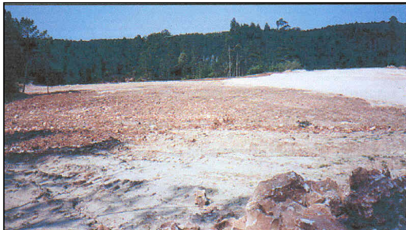
Fig. 3. Exemplo de uma pedreira aterrada no concelho de Cantanhede

Nas pedreiras aterradas existentes na área estudada, pode ser refira a existência de extensas áreas de solo nu, desprovido de vegetação, ou em quantidade reduzida, que incrementa o processo de erosão dos solos (Fig. 3). Nesta situação, o impacte visual é bastante elevado provocado, sobretudo, pela descontinuidade ao nível da paisagem (Gonçalo, 2002).