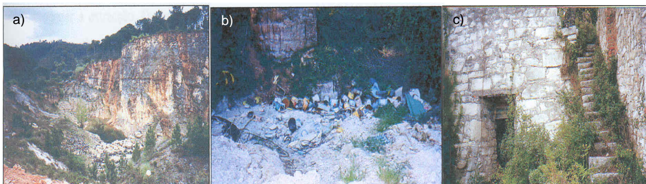
Fig. 4. Alguns impactes identificados em áreas de pedreiras desactivadas. a) Proliferação de vegetação em áreas abandonadas; b) deposição de resíduos variados; c) antigo forno de cal em ruínas numa pedreira desactivada do concelho de Cantanhede.

(Gonçalo, 2002). Outro dos impactes a ser referido, é a intensa proliferação de silvas ( Rubus ulmifolius ) e de tojos ( Ulex europaeus L. ) associada a estas pedreiras (Fig. 4a). Nalgumas das zonas é evidente o depósito de entulhos e resíduos de diversas origens, com a possível contaminação de solos e linhas de águas superficiais/subterrâneas (Fig. 4b), bem como, algumas infraestruturas abandonadas e em avançado estado de degradação, agravando o impacte visual (Fig. 4c).