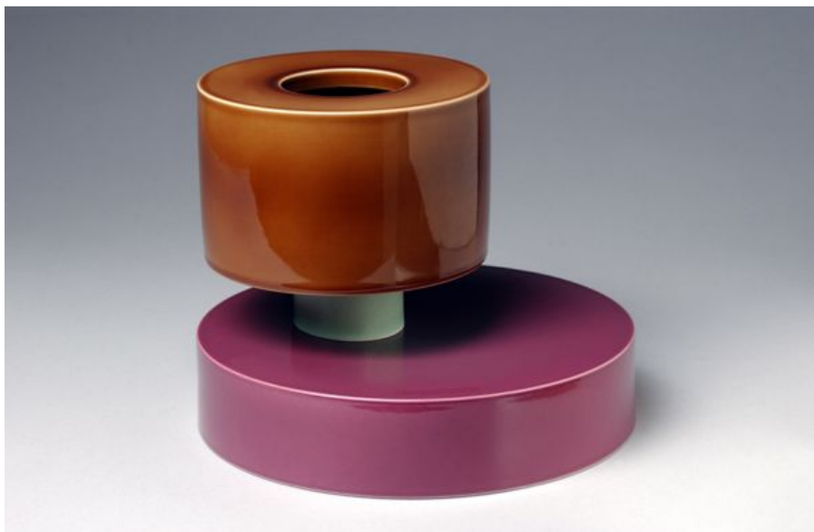
Fig. 13 e 14 - Tseui e Laure, Ettore Sottsass, 1994, Manufacture Nationale de Sèvres, porcelana.