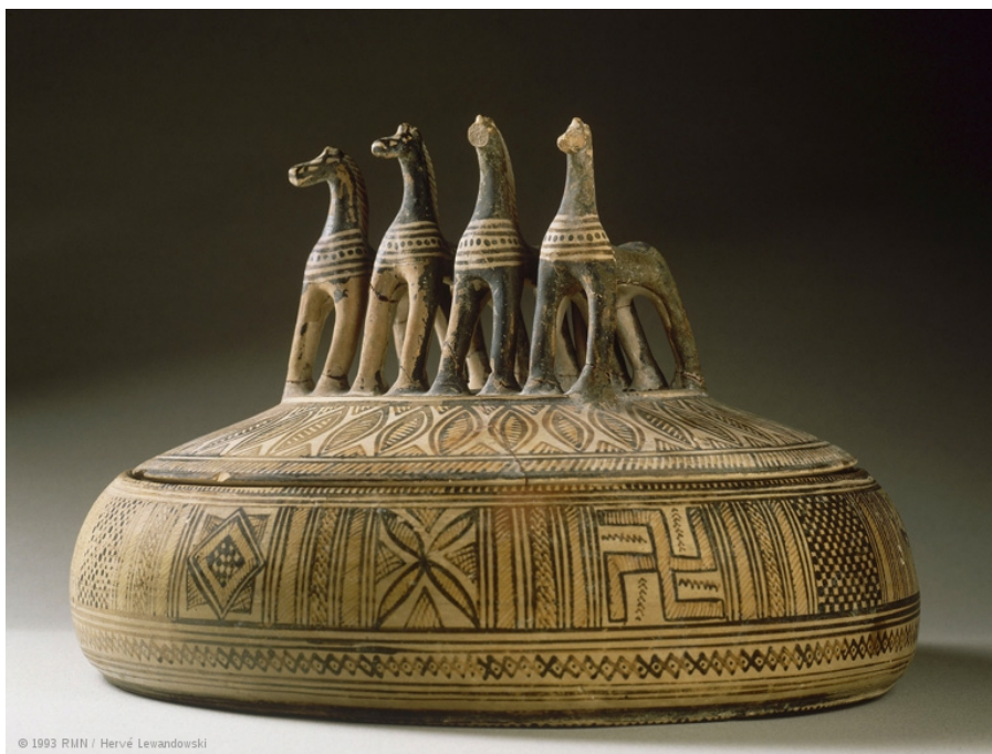
Fig. 1 e 2 - Attic pyxis, cerâmica grega período geométrico, séc. VIII A.C. e vaso Psykter VI A.C., Atenas.

direta não do divino mas da ideia, do inteligível que provém do sensível, a imitação não do arquétipo mas da forma sugerida pela matéria. Mais concetual portanto. “A beleza está associada ao prazer mas difere da utilidade porque o valor da beleza é intrínseco, e o valor da utilidade provém dos resultados”. (...) “Podemos ser capazes de fazer o que é necessário e útil, mas a beleza está acima disso tudo” (Aristóteles em Tatarkiewicz, 1962, p.151). Mas a arte é sempre inferior à natureza, e em todos os autores analisados, ela é a origem e o retorno de todas as coisas, mesmo nas coisas do espírito.