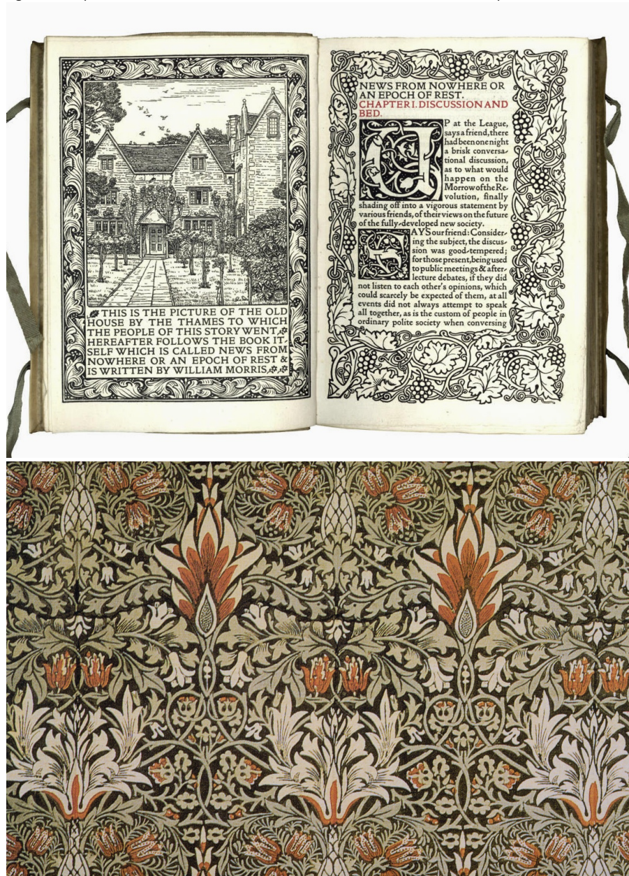
Fig. 5 e 6 - Capa de 'News from Nowhere' de William Morris em 1893 e 'Snakeshead print' em 1876.

Fonte: Capa de 'News from Nowhere' de William Morris em 1893, https://dantisamor.wordpress.com/2013/06/25/an-introduction 'Snakeshead print', 1876. Planet Art CD of royalty-free PD images William Morris: Selected Works.