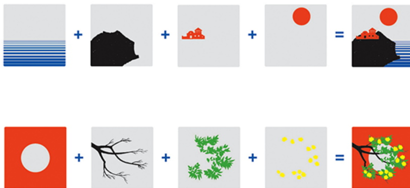
Figura 2: Più e meno, de Bruno Munari e Giovanni Belgrano, é um jogo visual composto por 72 cartões com imagens diferentes. Muitas dessas imagens apresentam fundos transparentes, para que possam se sobrepor e compor outras imagens mais complexas, estimulando as habilidades criativas das crianças.

Nos projetos dedicados à literatura para infância, a intenção poética de Munari é construída a partir de enredos visuais, mais ou menos complexos, tanto no que ao valor estético diz respeito, como no domínio dos aspectos técnicos de composição. Os seus livros apresentam uma narrativa visual coesa e potenciam o desenvolvimento de habilidades cognitivas e motoras. É neste sistema pedagógico que o trabalho de Munari introduz uma relação complementar de aprendizagem face aos dogmas do ensino (escolar) e da literatura clássica infantil — em que as imagens possuem um cariz decorativo e existem em segundo plano e de forma redundante—, através de narrativas visuais não-lineares, detentoras de simplicidade e coerência que se revelam cativantes à medida que são observadas e manipuladas. Seguidor do princípio funcionalista de que “a forma segue a função”[1], defende uma linguagem visual universal assente na simplicidade e clareza da informação. A hierarquia visual estabelecida na maioria dos seus projetos editoriais é apresentada sob um layout pouco rígido onde se denota um equilíbrio visual na disposição de todos os elementos gráficos conseguidos através da preferência pela proporção quadrada ou rectangular como formato.