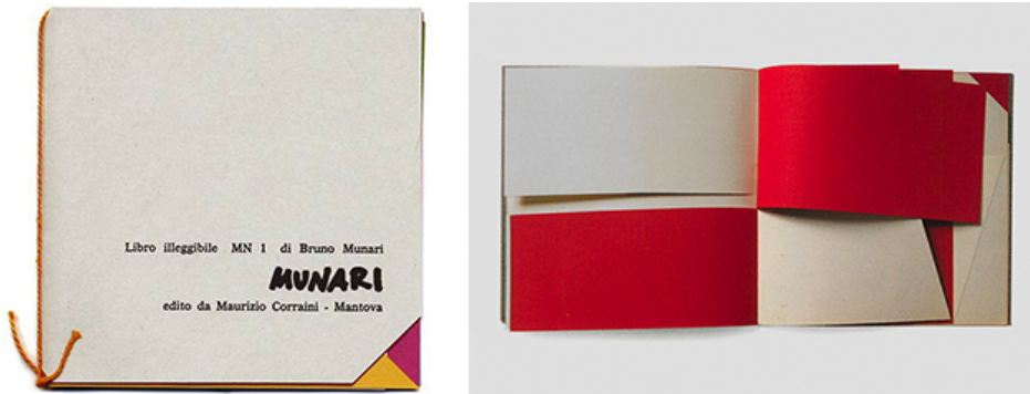
Figura 3: Libro Illeggibile MN1, Bruno Munari, 1943.

Os Livros Illegíveis de Munari são uma série de livros sem texto em formato quadrado, páginas de diferentes cores e cortes, destinados a crianças onde apela ao aspecto táctil e à criatividade. Segundo Maffei [2], “the idea of ‘illegibility’ is the most striking part of Munari’s research in terms of new aesthetic functions of the book (...) When the book loses its primary purpose—the text—it multiplies its morphologic and aesthetic possibilities through shape and color. The illegible book opens up new communicative properties of the book object that had never previously been considered.” (“Texture Yes, Words Not So Much: How Artist Bruno Munari Blew Up The Book”, para. 3)