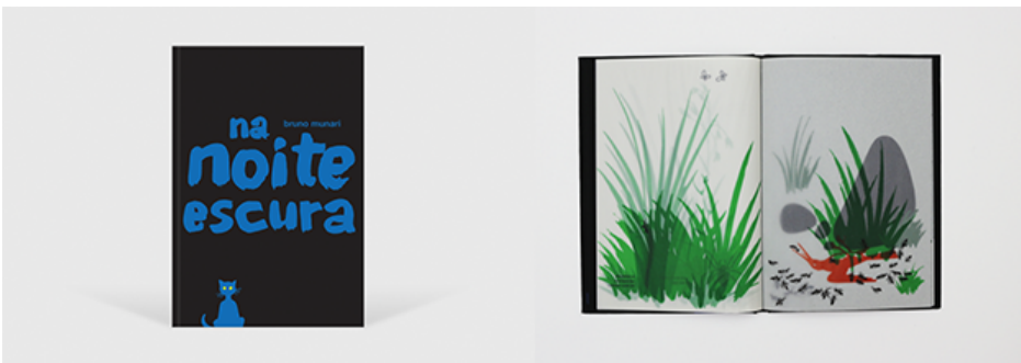
Figura 4: Edição portuguesa do livro Na noite escura, Bruno Munari, pela editora Bruuá.

De formato quadrado, os pré-livros, criados entre 1949 e 1952, consistem numa série de 12 livros, sem texto e com particularidades distintas. De forma a cativar as crianças à prática de leitura, Bruno Munari, concebe estes objetos, que são autênticos estímulos visuais, tácteis, sonoros, térmicos e matéricos. A experiência de leitura da criança é feita através da percepção das formas e da sensibilidade aos distintos materiais. Toda esta relação torna a experiência mais rica, desde o primeiro contacto com o livro, menos repetitiva (novidade), (re)modela a percepção sobre um determinado conceito e intervém no conhecimento e na formação de uma mentalidade mais elástica.