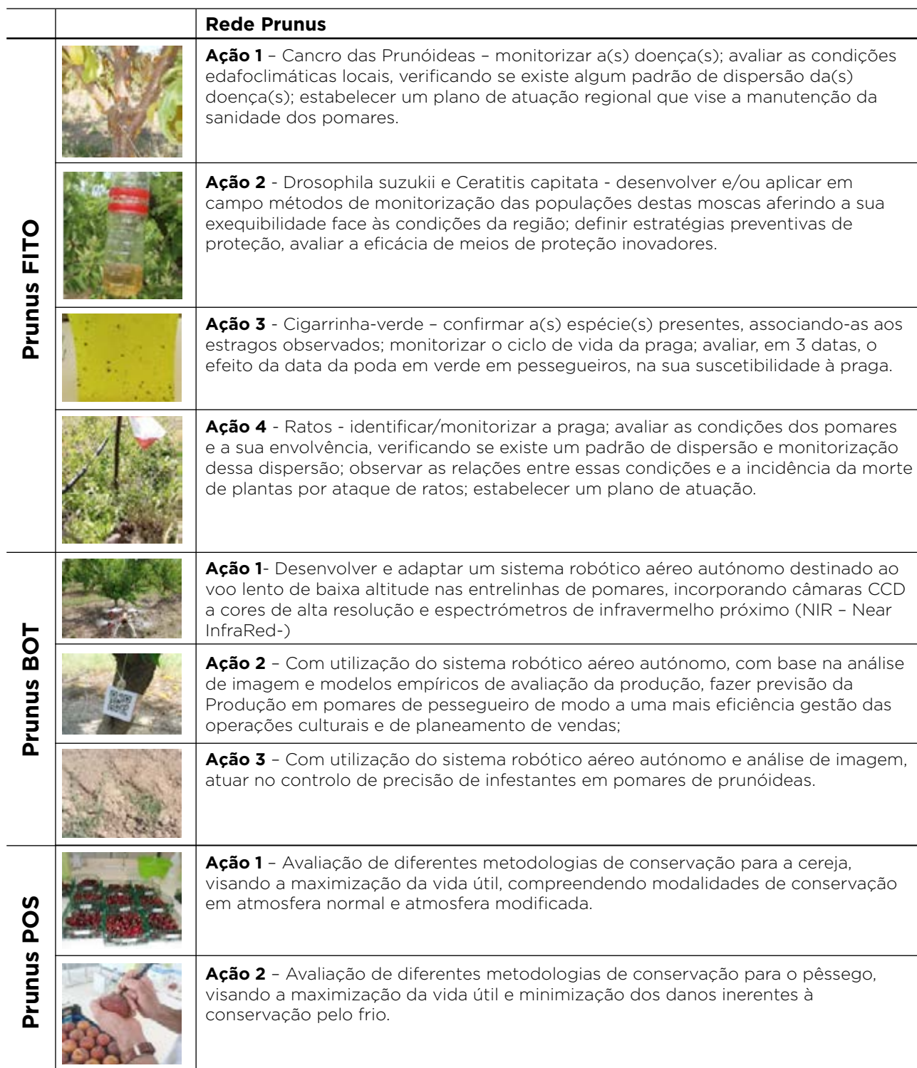
Quadro 2 - Caracterização da Rede Prunus