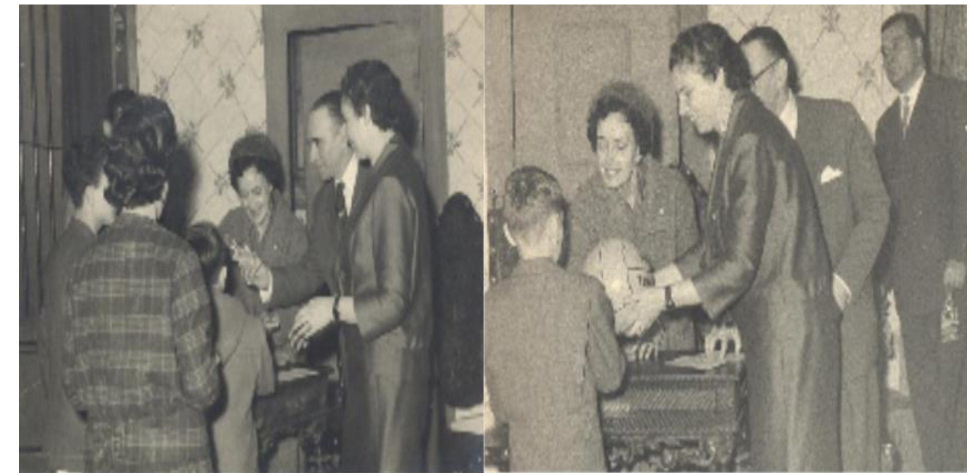
Fotos da entrega de brinquedos aos filhos dos funcionários do BNU – Festa de Natal e Ano Novo de 1958

A crescente procura aumenta a necessidade de dar resposta às solicitações das famílias e passa a ter diversas valências para promover desenvolvimento da criança; despistar eventuais atrasos de desenvolvimento; promover a inclusão de crianças com necessidades especiais na família e na comunidade.