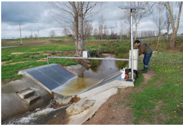
Figura 2 – Estación hidrológica instalada en la sección de referencia de la cuenca de estudio.

Para este estudio fue instalado en 2004 una estación hidrológica en la sección de salida de la cuenca (39°50'48" N, 7°10'00" W), que consiste en un aforador de sección compuesta (triangular y trapezoidal) (Bos et al. , 1991) para medir la escorrentía equipado con un sensor de ultra-sonidos dirigido a la superficie de la corriente que registra continuamente el nivel del agua (Figura 2).