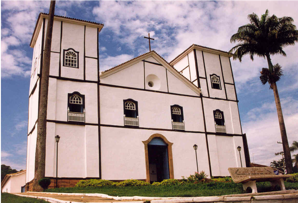
Figura 2: Fachada principal da Igreja Matriz de Pirenópolis/GO.