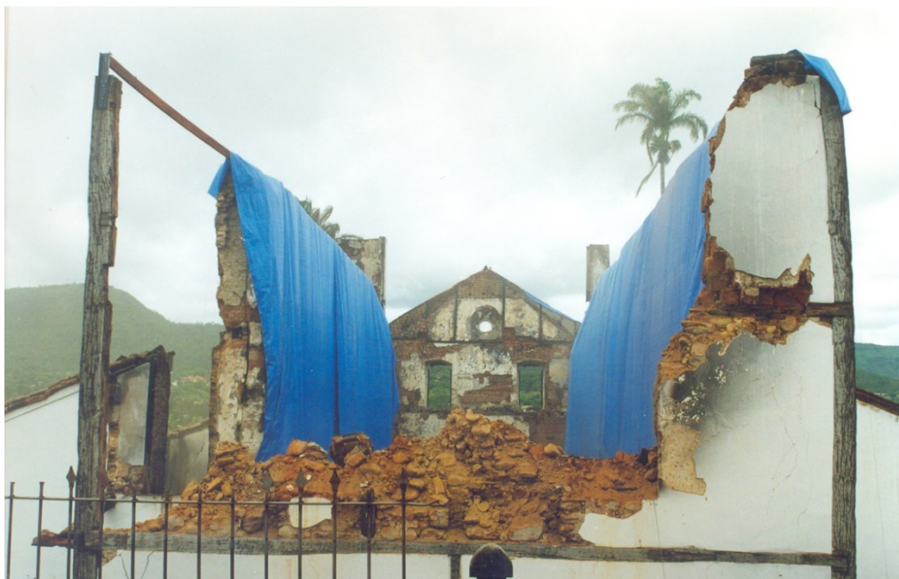
Figura 3: Estrutura da Igreja Matriz de Pirenópolis/GO, após o incêndio de 2002, vista da fachada posterior.

emergências são móveis, as saídas de emergência só precisam ter o sentido de abertura das portas invertido e o controle de material de acabamento consiste no tratamento antichamas para maior proteção contra incêndio. No entanto, tais medidas não foram instaladas corretamente e, até o ano de 2020, nenhum projeto de incêndio foi aprovado junto ao corpo de bombeiros local (CBMGO) 2 [3].