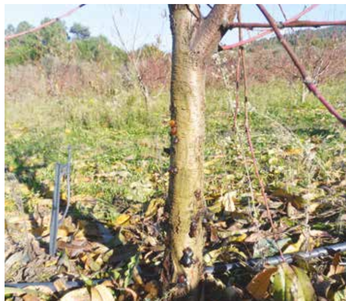
Figura 9 – Cancro bacteriano

O óidio é também uma doença bastante presente, sendo causada pelo fungo Sphaerotheca pannosa , um ectoparasita, que ataca as folhas e frutos. A sintomatologia consiste no aparecimento de mancha pulverulenta fina e branca composta por conídeos. As folhas infetadas apresentam ondulação do limbo, com manchas esbranquiçadas e os jovens frutos surgem manchas esbranquiçadas de con-