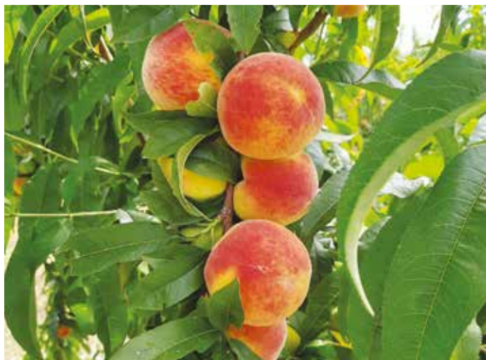
Figura 1 – Pêssegos

O pessegueiro é uma árvore perene (que dura vários anos) e caducifolia (que passa anualmente por um período sem folhas, designado por repouso invernal), e que retoma o seu desenvolvimento anualmente através do abrolhamento dos gomos formados no ano anterior.