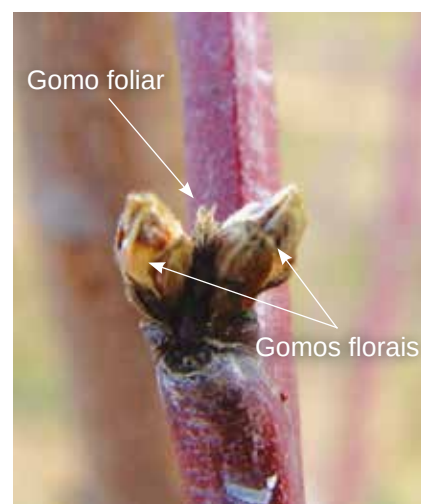
Figura 2 – Gomo foliar e gomos florais num ramo de pessegueiro

O pessegueiro possui gomos foliares , que, pelo seu desenvolvimento dão origem a ramos que têm folhas, também designados lançamentos, e que asseguram o crescimento vegetativo desse ano e a produção do ano seguinte. Possui também gomos florais que, pelo seu desenvolvimento dão origem a flores que podem transformar-se em frutos assegurando a produção. Os gomos localizam-se nos ramos com um ano e maioritariamente desenvolvem-se na axila das folhas, sendo os gomos foliares mais pequenos e pontiagudos e os gomos florais mais volumosos. Gomos foliares e florais aparecem frequentemente em posição colateral ao longo do ramo (Figura 2). Cada gomo