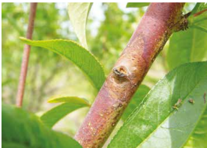
Figura 8 – Monilia

ção, logo na fase inicial da rebentação dos gomos foliares. Quando a temperatura mínima atinge 7°C, estão reunidas as condições para a germinação dos conídeos e o início das infeções, que estarão dependentes do tempo em que os tecidos vegetais permanecem molhados. Este último fator dita a severidade da infeção. A lepra ataca sobretudo as folhas, apesar de se poderem verificar infeções em ramos e frutos. Após infeção e incubação, as folhas jovens apresentam engrossamentos, deformações e endurecimentos dos tecidos (Vieira e Silvino, 2016). Posteriormente escurecem, secam e permanecem ligadas às árvores (Figura 7). Nas condições da Beira Interior, o controlo da doença requer a aplicação de produtos fitofarmacêuticos, no período entre o entumescimento dos gomos até ao vingamento, sempre de carácter preventivo.