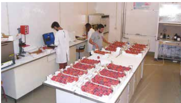
Figura 6 – Análise de qualidade de pêssegos em laboratório no âmbito de projetos de investigação

A lepra é uma doença chave, dado que ocorre em todos os pomares de pessegueiros ou nectarinas e requer controlo químico sistemático, sendo causada pelo fungo Taphrina deformans (Berk.) (Layne e Bassi, 2008). O fungo hiberna nas rugosidades e escamas dos gomos, na forma de conídeos. Na primavera, a planta fica recetiva à infe-