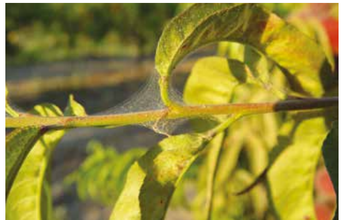
Figura 11 – Aranhaço amarelo

O conjunto das prunóideas apresenta grande inter-compatibilidade de enxertia, utilizando-se diversas espécies de Prunus como porta-enxertos, ou mesmo híbridos de diversas espécies. A escolha deve fazer-se em função das características edáficas, nomeadamente, preferir Porta-enxertos de pessegueiro, quando os terrenos são arejados, permeáveis, profundos; porta-enxertos de ameixeira, nos casos de solos menos permeáveis, mais pesados e nos casos de replantação para evitar fenómenos de fadiga dos solos e híbridos de amendoeira com pessegueiro, quando o terreno seja calcário uma vez que a amendoeira é mais resistente ao calcário e o pessegueiro é sensível (sempre que o solo possua mais de 7 a 8 % de calcário ativo ou quando o solo tenha reação básica) ou se pretende tolerância ao stresse hídrico nos casos de escassez de água. A escolha do porta-enxerto deve ser realizada com base no vigor e capacidade produtiva que induz à cultivar, bem como às resistências que apresenta a parâmetros edáficos como encharcamento, salinidade ou agentes patogénicos. Como o pessegueiro é autofértil, as plantas são, maioritariamente homocigóticas, pelo que são utilizados porta-enxertos francos (ou seja, obtidos por germinação seminal), que apresentam grande homogeneidade.