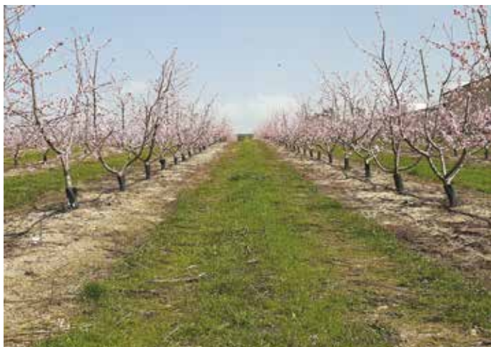
Figura 5 – Solo nu na linha e envelvamento da entrelinha

infestantes na linha das plantas é particularmente importante no primeiro ciclo vegetativo após a plantação, pois as jovens plantas apresentam uma taxa de crescimento menor que as infestantes. Uma técnica dispendiosa, mas com resultados positivos no controlo das infestantes e no crescimento das plantas é a utilização de cobertura da linha com filmes. Podem utilizar-se plásticos com cores distintas, com vantagens na economia de água por redução da evaporação. A utilização de uma manta fabricada a partir de desperdícios da indústria têxtil (Manta Ecoblanket) (Simões et al. , 2017c), permitiu verificar que, para além do controlo das infestantes, a manta reduz a amplitude térmica ao nível do solo e conserva maior teor de humidade no primeiro ciclo vegetativo das plantas. O efeito da manta na temperatura e humidade do solo foi menor quando o desenvolvimento da copa das plantas era suficiente para fazer ensombramento da linha, o que ocorre após o 3º ciclo vegetativo. Num futuro de previsível escassez de água e quando se pretende uma agricultura mais sustentável, maior ênfase devia ser dada à utilização de coberturas do solo para controlo das infestantes.