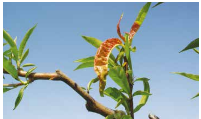
Figura 7 – Lepra