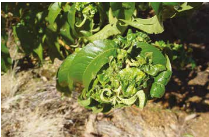
Figura 10 – Afídeo verde

O afídeo verde do pessegueiro aparece todos os anos (Figura 10). Em pomares em plena produção a sua importância é tanto maior quanto mais próximo o ataque estiver do período de floração, onde, por um lado, se devem evitar as intervenções químicas (para proteção dos insetos polinizadores), e, por outro lado, os estragos são muito nocivos (morte de flores; picadas sobre o cálice das mesmas ou sobre frutos recém-vingados), e inibição do crescimento das folhas que ficam encarquilhadas e pegajosas devido à exsudação de seiva. O piolho verde do pessegueiro ataca as plantas no início da rebentação levando à paragem de crescimento dos gomos, ao encarquilhamento das folhas e à consequente debilidade das plantas. Em plantas jovens (após plantação) levam à deformação dos ramos fundamentais à formação da planta, comprometendo a obtenção de árvore com boa estrutura. A monitorização realiza-se por observação visual (Barateiro et al. , 2016).