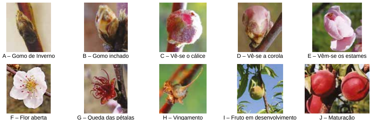
Figura 3 – Estados fenológicos do pessegueiro (adaptado de Bagiolini)

A poda de inverno é a primeira operação cultural a efetuar no ciclo vegetativo, decorrendo desde a queda da folha até ao abrolhamento. Nos pessegueiros a poda é uma operação fundamental que tem de ser realizada pelo menos uma vez por ano, pois é uma árvore que tem um forte crescimento anual, crescimento esse constituído por inúmeros ramos. Um pessegueiro que não é podado rapidamente entra em declínio. A poda tem como objetivos principais (1) manter o equilíbrio entre o crescimento vegetativo e a frutificação, (2) permitir a entrada de luz para que as folhas otimizem a capacidade fotossintética, (3) manter a altura/volume da copa de modo a facilitar as operações culturais, (4) procurar atingir a carga ótima de frutos para minorar o posterior ajuste através da monda, (5) distribuir os ramos pela copa para que a estrutura consiga suportar o peso dos frutos. A poda é uma operação dispendiosa, mas há uma observação cuidada das plantas durante a