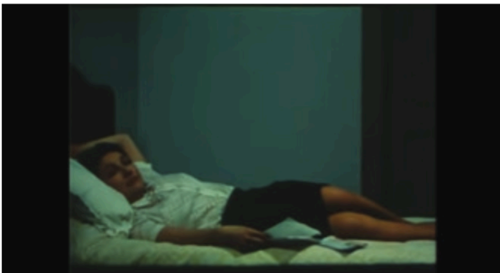
Fig.1 Brandos Costumes (1975) - 19m45seg.

de créditos ao figurinista ou responsável de créditos no guarda-roupa, torna complexa a tarefa de extrair mais detalhes filmicos.