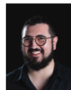
JOÃO ALBERTO BAPTISTA BARATA 1,2

This article presents an original approach to the miniskirt as an "invisible" sign in Portuguese cinema, analyzing how its subtle presence—though laden with social and cultural meanings—contributes to narrative construction and character development. It does so within a context where the symbolic role of costume design, and particularly of the miniskirt, remains underexplored, thus seeking to address this gap in academic research. The study concludes that the success of a costume's communication depends on the viewer's familiarity with the cultural meanings associated with the garment and that costume design plays a crucial role in the connection between fashion, cinema, and social discourse. The miniskirt serves as a case study to highlight the different interpretations of a garment's meaning over time and across diverse social contexts.