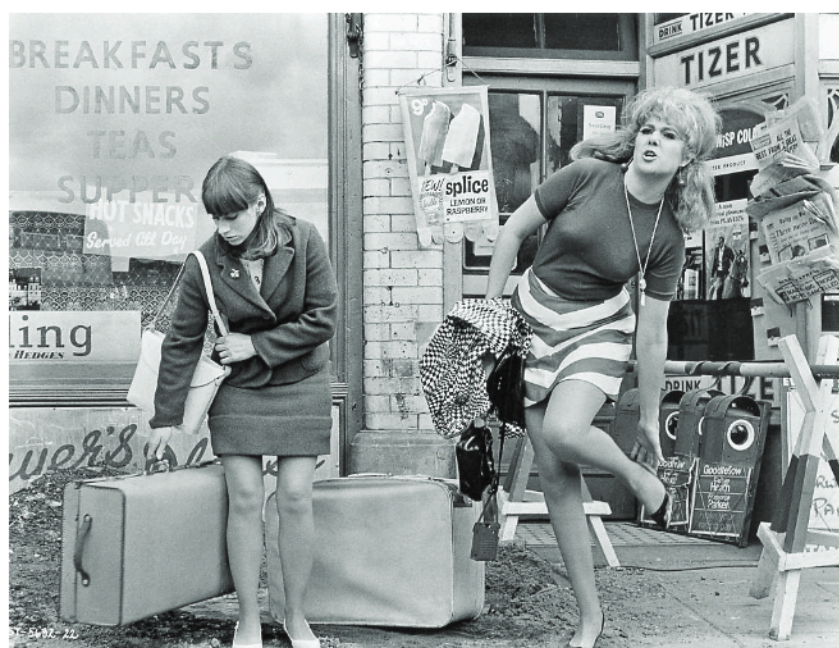
Fig.2 Smashing time (1967) – Comédia musical que critica a nova geração britânica dos anos 60.

Dentro da mesma corrente das novas vagas de cinema europeus, a minissaia é uma peça do figurino relativamente comum. Tão normalizada que anos anteriores já fazia parte do figurino estereotipado, inclusive em comédias britânicas como visível na Fig.2.