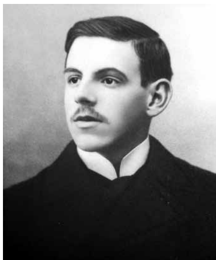
Francisco Tavares Proença Júnior

Pai fundacional da arqueologia na Beira Baixa, Francisco Tavares Proença Júnior (1883 - 1916) desenvolveu, durante a sua curta vida, um conjunto de interesses e de áreas de estudo que o afirmam como uma relevante e incontornável personalidade nas dinâmicas da história das ciências nesta região periférica.