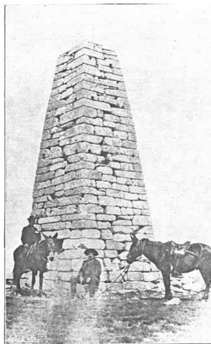
Marco Geodésico da Torre, Serra da Estrela.

no mais escabroso do nosso terrão, e chegou ao alto da serra onde nós podemos ver já dois hotéis, uma pensão, e muitas vilas e chalés modernos ali construídos por aqueles que aquelas elevadas estações não buscam a vida e a sonda que tentam fugir-lhe. Pena é que o único ponto existente no nosso país em condições de o transformar numa excelente estação climatérica de verão, seja tão desprezado pelos nossos governadores desleixados! Se no nosso país houvesse alguém capaz de pensar no que seja para um país como o nosso esses milhares de tuberculosos e candidatos a esta terrível enfermidade, de há muito nós veríamos nas alturas dos Hermínios um ou mais sanatórios atente ao sol nestas fachadas. Nessas fachadas, que teriam a coroa-las o nome de Sousa Martins, nós veríamos em letras de ouro dois versos do segundo acto de Fidelio; e não veríamos na frente desses edifícios, gravado com letras de fogo um terrível verso de Dante.»