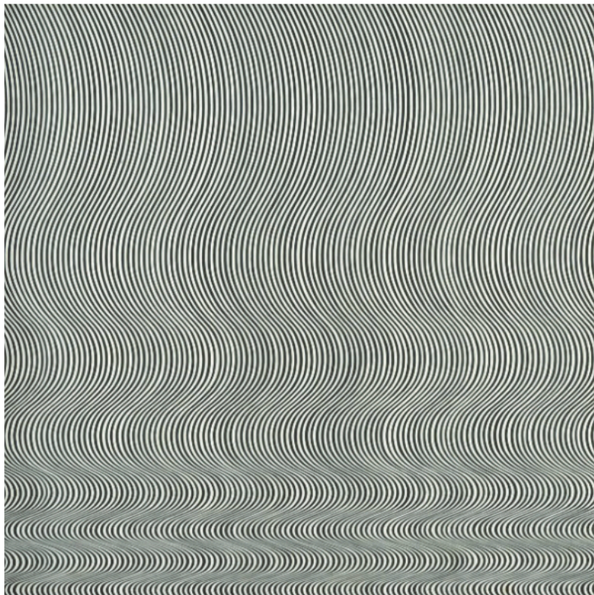
Fig. 1 Pintura “Fall” de Bridget Riley. (Riley, 1963)

A organização das células ganglionares, centro-periferia explica muitos dos efeitos óticos da Op Art na percepção visual. As rápidas e constantes respostas ao aumento de luminância numa região “on” do campo recetivo ou diminuição da luminância numa região “off”, e vice-versa, redução de luminância numa região “on” do campo recetivo ou aumento da luminância numa região “off, provoca na percepção visual pontos escuros onde eles não existem - imagens fantasmas. A pintura “Fall” de Bridget Riley (Fig.1) é um exemplo desse efeito ótico.