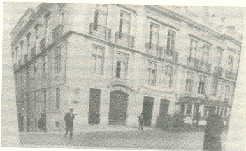
Figura 1- Fachada do Instituto de Orientação Profissional -Lisboa (1925)

em abril de 1928, em que considera o instituto um dos melhores da Europa «sob o ponto de vista dos aparelhos e instrumentos para diagnóstico das aptidões e estudo das atividades profissionais» (VASCONCELOS, 1928 a: 25).