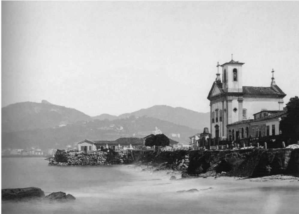
Fig. 2 Praia e Igreja de Santa Luzia, circa 1906.