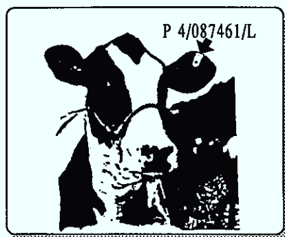
Fig. 1 - Exemplo de um brinco com número SIA atribuído a um bovino raça Frísia nascido na Região Agrária da Beira Interior.

da DGP (modelo 111/DSFMA), que deve ser preenchido quando se identifica o animal. Simultaneamente, deve ser colocada no bordo superior da orelha esquerda uma marca auricular com o número SIA, que figura também naquele impresso.