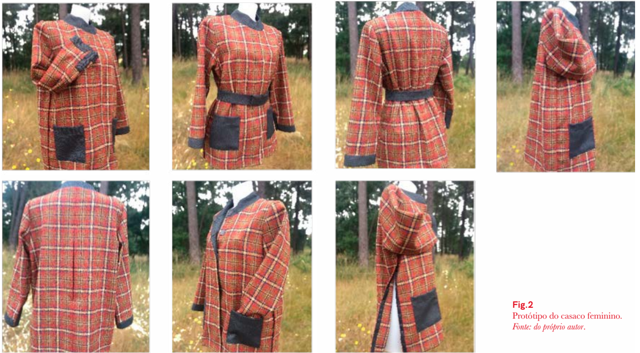
Fig.2 Protótipo do casaco feminino.

Os materiais selecionados para a realização do protótipo são tecidos em lã, e os aviamentos são um fecho de pressão - Rail Tapey - da Morito e ainda fita adesiva magnética. Para a elaboração deste projeto contou-se com o apoio da Empresa Fitecom – Comercialização Industrialização Têxtil, S.A., localizada em Castelo Branco.