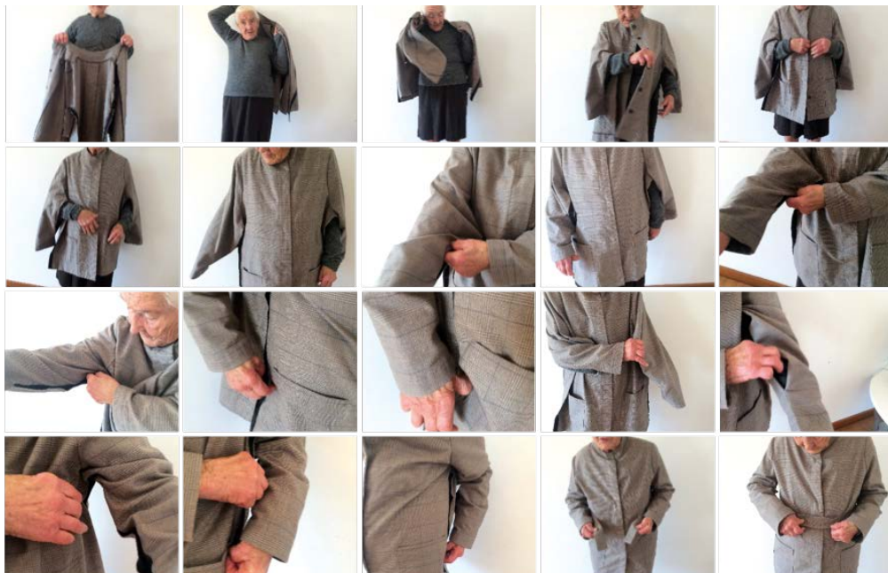
Fig. 5 Teste de usabilidade do protótipo 2.