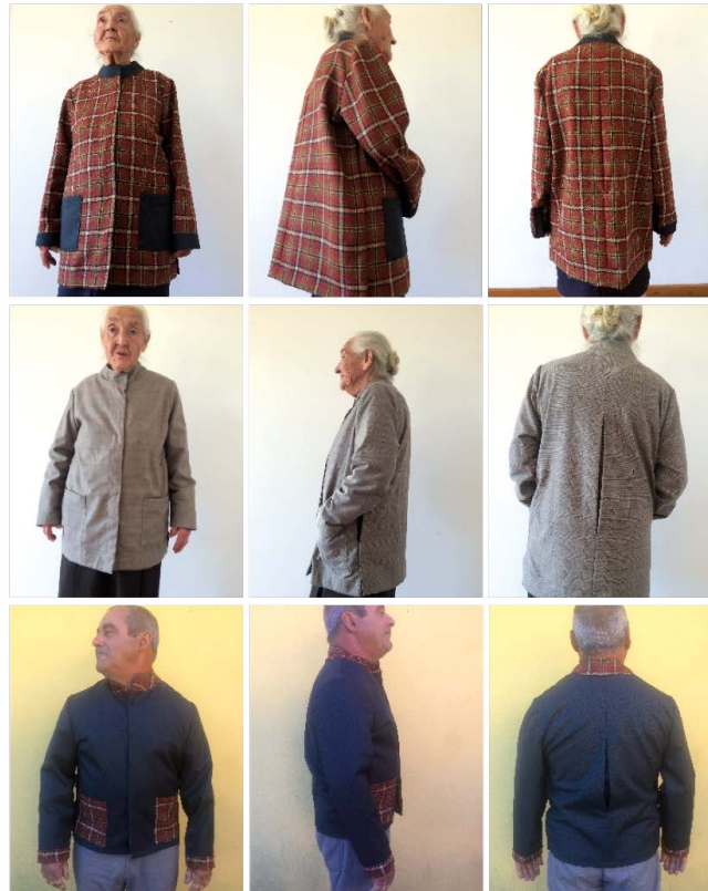
Fig. 5 Protótipos realizados (1º e 2º respetivamente).

A ação de vestir/despír têm de ser de fácil realização e entendimento, para não constrianger o utilizador (Vianna, 2016). Assim sendo, na ação de vestir e tirar o casaco, verificar-se que a amplitude máxima dos braços foi significativamente diminuída. Esta amplitude de movimento reduzida, terá implicações no movimento de vestir o casaco, nomeadamente na força exercida nos músculos do peitoral maior e do trapézio.