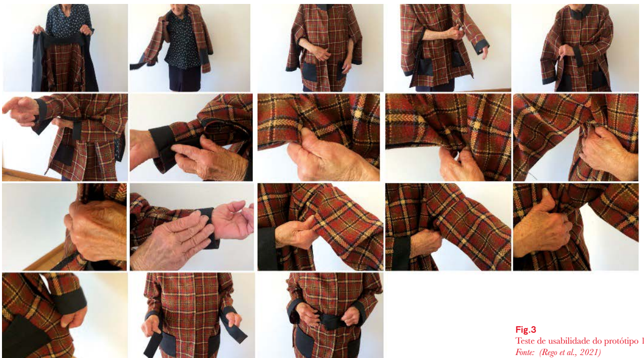
Fig.3 Teste de usabilidade do protótipo 1.