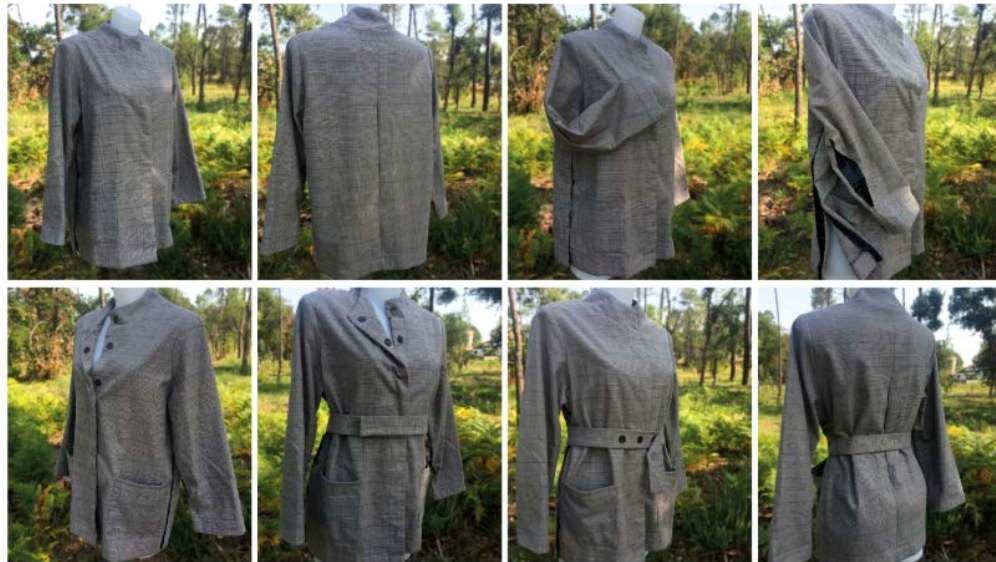
Fig. 4 Protótipo 2 do casaco feminino.

Os materiais selecionados para a realização do protótipo são tecidos 80% algodão e 0% lã, e os aviamentos são um fecho de pressão - Block Tapey - da Morito e ainda fita adesiva magnética. Para a elaboração deste projeto contou-se com o apoio da Empresa Somelos-Tecidos, S.A., localizada em Guimarães.