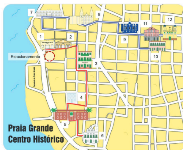
Fig.3 Sugestões de roteiros turísticos em azul e vermelho.

Em cada etapa foram selecionadas as informações significativas, tais como: seguir o mesmo trajeto que a maioria dos visitantes realiza: caminhando e fotografando ruas, ladeiras, becos e escadarias. Após avaliação dos percursos, foram estabelecidos dois roteiros de visitação, em azul e vermelho. Ambos têm o ponto de partida no amplo estacionamento da Praia Grande, que fica ao nível do mar e serve com principal acesso, como demonstrado na figura 3.