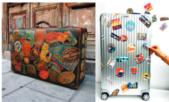
Fig.1 Exemplo de bagagem de viagem e posterior customização pela Rimowa.