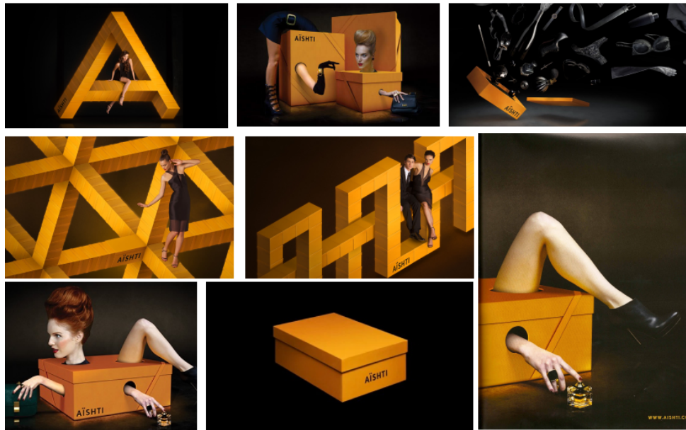
Fig. 5 – Campanha desenvolvida por Jessica Walsh e Sagmeister para a marca Aishti (4)

Também entendemos os elementos mapeados como transversais, assim como Joly (2012), nos fala da imagem, mas também nos fala da cor ao se referir unicamente a estética da fotografia. E elementos como luz, ângulo ou ponto de vista por exemplo são princípios relacionados à composição fotográfica, já elementos como forma e movimento podem estar tanto relacionados a fotografia quanto a composição da imagética se considerarmos a imagética relacionada com tudo o que diz respeito à imagem e às características visuais que fazem pertencer a uma determinada da marca (Oliveira, 2015), a qual incluímos a iconografia + ilustração e imagem.