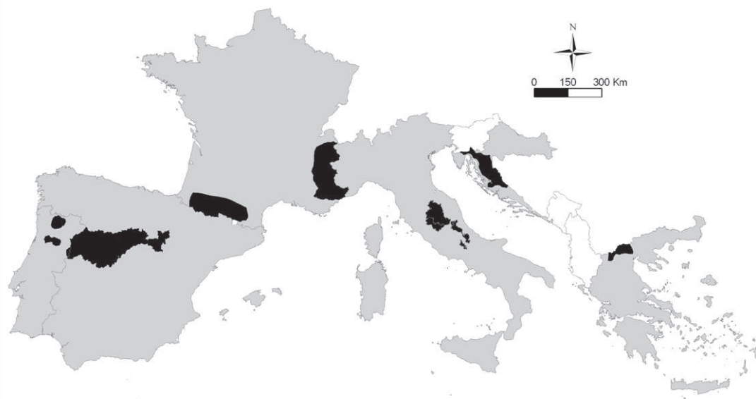
Figura 2. – L'area di studio del progetto LIFE COEX. In grigio i paesi partecipanti e in nero le aree in cui verranno svolte le attività.