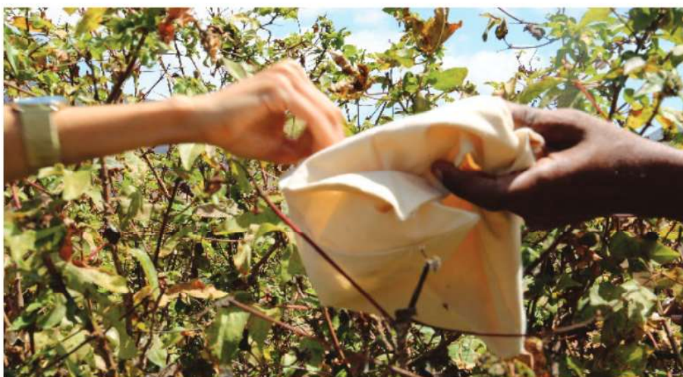
Fig. 3 Colheita de 2021, no âmbito da visita de Ciclo de Algodão - curso de transformação de algodão.

âmbito das ações “Fiando o algodão das novas gerações”, a qual contou com a participação do formador Marcelino dos Santos, das autoras de NEVE INSULAR e de oito formandos [3]. A formação teve a duração de um mês e passou por todo o ciclo do algodão desde a plantação até à tecelagem, no final os participantes partilharam a sua experiência com o público no Centro Cultural de Mindelo e foi apresentada a tapeçaria coletiva realizada, “Mon na cotton” (Fig. 4). São também realizadas formações dirigidas especificamente a mulheres no sentido de as emancipar. Entre junho e outubro de 2022 foi realizada, uma formação em agroecologia dirigida às mulheres do Vale do Calhau e Madeiral, Ilha de São Vicente, introduzindo os princípios da biodiversidade. Para além de um espaço de formação, este projeto contempla também a realização de