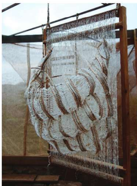
Fig. 7 “Avental”, tecelagem escultórica coletiva, grupo da Residência Artística Rbera, 2022.

No contexto do projeto NEVE INSULAR, o panú di téra , além de representar a complexa