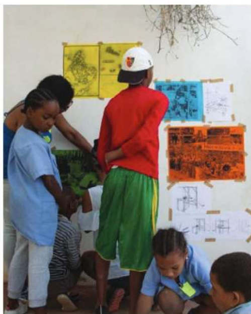
Fig. 2 Workshop realizado no âmbito do projeto NEVE INSULAR, 2019.

Mais recentemente, em Abril de 2021, foi realizada uma formação do ciclo do algodão, no