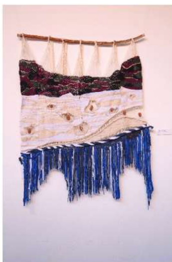
Fig. 4 “Mon na Cotton”, tapeçaria coletiva, grupo Ciclo do Algodão-projeto NEVE INSULAR, 2021.