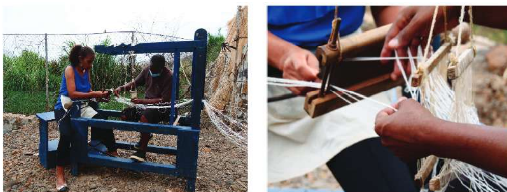
Figs. 5 e 6 Residência artística Rbera, 2021.

de forma que iam aproximando-se à medida que avançavam na tecelagem (figs. 5 e 6). Esta partilha da urdidura, geralmente individual, simbolizou o princípio subjacente a esta residência: o conceito de conexão entre pessoas, matérias-primas e saberes. Conexão entre pessoas: habitantes da cidade e agricultores, sendo que, como sempre que há um evento do projeto, se vendem e promovem os produtos agroecológicos; entre matérias-primas: experimentaram-se várias matérias na tecelagem, como o carrapato, folha de bananeira, troncos, sisal, algodão e sementes; entre as pessoas e o território; e, por fim, entre saberes técnicos de vários domínios, de diferentes matérias-primas e sobre biodiversidade.