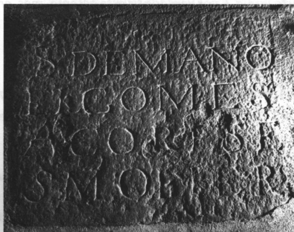
Fig. 1 - Lápide de Manuel Gomes Açores.

A 10 de Outubro de 1630 faz exame para o cargo de cirurgião, tendo sido examinado pelo cirurgião-mor do reino doutor António Francisco Milheiro, conforme regista a figura 2 2 . Do resto da sua vida nada mais sabemos.