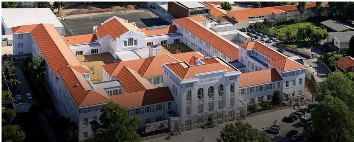
Figura 1 - Autor desconhecido, fotografia aérea do Conservatório do Porto, s/ data.