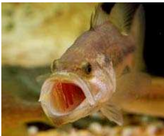
Figura 2 – Enorme boca do achigã.

orifícios nasais externos situados à frente dos olhos que comunicam internamente com os sacos olfactivos. Possui uma linha contínua que se estende ao longo do corpo, desde o opérculo até à barbatana caudal, designada de linha lateral, onde se podem contar entre 60 a 70 escamas. Esta linha é de cor preta e possui uma fiada de manchas castanhas ou negras, bem visível nos adultos. Apresenta o dorso bronzeado – escuro com um tom verde-escuro ou olivácio, os flancos são verde – olivácios com reflexos prateados ou dourados. O ventre é branco amarelado, algumas vezes quase branco e o opérculo tem duas barras escuras e uma mancha preta. Sobre os flancos, abaixo da linha lateral, existem algumas pintas irregularmente disseminadas (Bruno e Maugeri, 1995; DPAI, 1999; Geraldles, 1999; Von der Emde; Mogdans e Kapoor 2004).