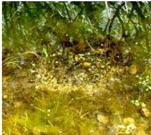
Figura 4 – Ninho de achigã em fase de construção junto à margem (ESACB 39° 49' 27,71" N; 07° 26' 58,55" W, início de Abril).

e do esperma (Tidwell et al., 2000). Uma fêmea põe cerca de 750 a 11500 ovos de cor amarelo claro e com 1,5 a 2,5 mm de diâmetro. Os ovos aderem ao substrato do fundo e são cuidadosamente vigiados pelo macho (Bruno e Maugeiri, 1995). Várias fêmeas podem desovar num mesmo ninho que fica, normalmente, com algumas centenas ou milhares de ovos (Davis e Lock, 1997; Tidwell et al., 2000).