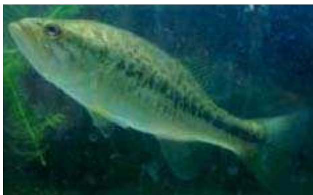
Figura 1 – Exemplar de achigã ( Micropterus salmoides ) preparando-se para atacar a presa.

O achigã (figura 1) apresenta um corpo alongado, ovoidal e ligeiramente comprimido nos flancos. O perfil do dorso é mais ou menos convexo consoante a idade. Possui uma cabeça forte, representando cerca de 1/3 do comprimento total do corpo sem incluir a barbatana caudal (Bruno e Maugeri, 1995). O comprimento desta espécie piscícola pode ultrapassar os 60 cm. Normalmente os machos não ultrapassam os 40 cm enquanto que as fêmeas podem ultrapassar os 56 cm. O peso atinge os 7 a 12 kg com valores mais frequentes variando entre os 100 g e os 2 kg. O mais velho achigã capturado nos EUA tinha 23 anos de idade, sendo espetável que atinjam uma idade média de 15 anos em meio selvagem. Em cativeiro, a idade mais avançada registada é de 11 anos, com tempo de vida médio de 6 anos (Bailey, Latta e Smith, 2004; Boschung, Mayden e Tomelleri, 2004). De acordo com Pereira (1994), em Portugal os achigãs não ultrapassam os 60 cm de comprimento e os 3 kg de peso.