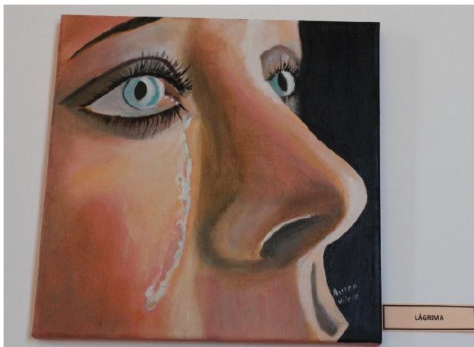
Figura 1 - exemplo de transição pelo autoconhecimento 1

Nessa didática de coaching, as buscas dos alunos artistas passaram a ser mais sofisticadas e personalizadas. Como exemplo, a imagem religiosa tornou-se um cenário onde as personalidades bíblicas são retratadas como pessoas do dia a dia. A imagem de rosto de pessoa que inicialmente era um retrato de político passou a ser uma imagem que retratava uma mulher a chorar (figura 1), refletindo o momento emocional da autora da obra. O desenho simples de mangá passou a ser uma produção temática para concorrer em concurso próprio para idade adolescente (figura 2).