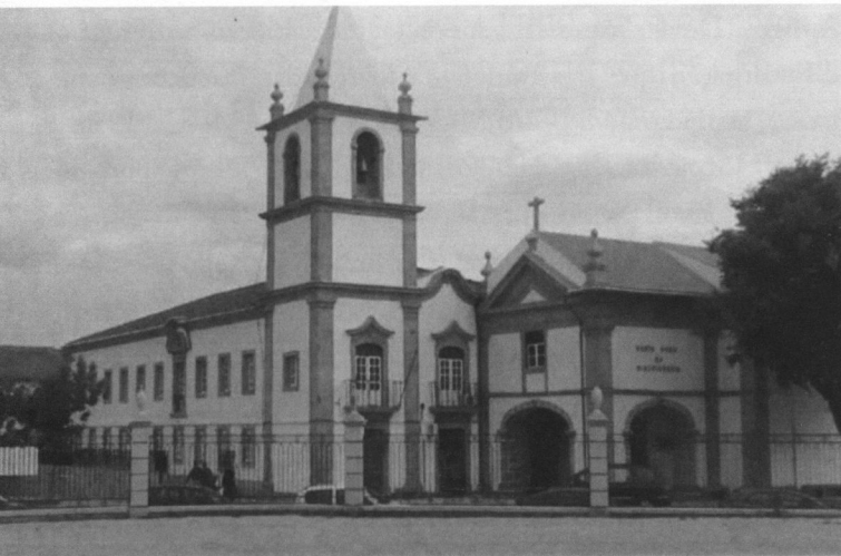
Antigo Convento da Graça