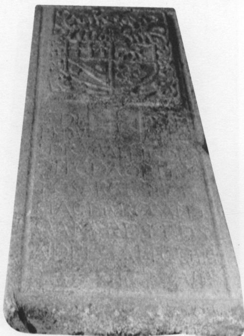
Inscrição nº 2