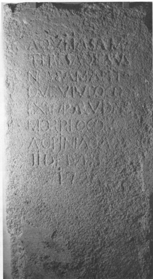
Inscrição nº 4