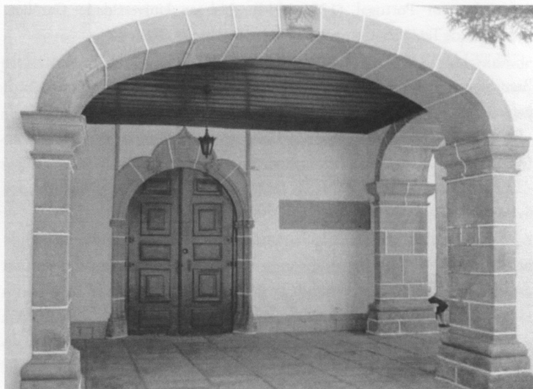
Alpendre da igreja da Graça, com inscrição ao lado do portal