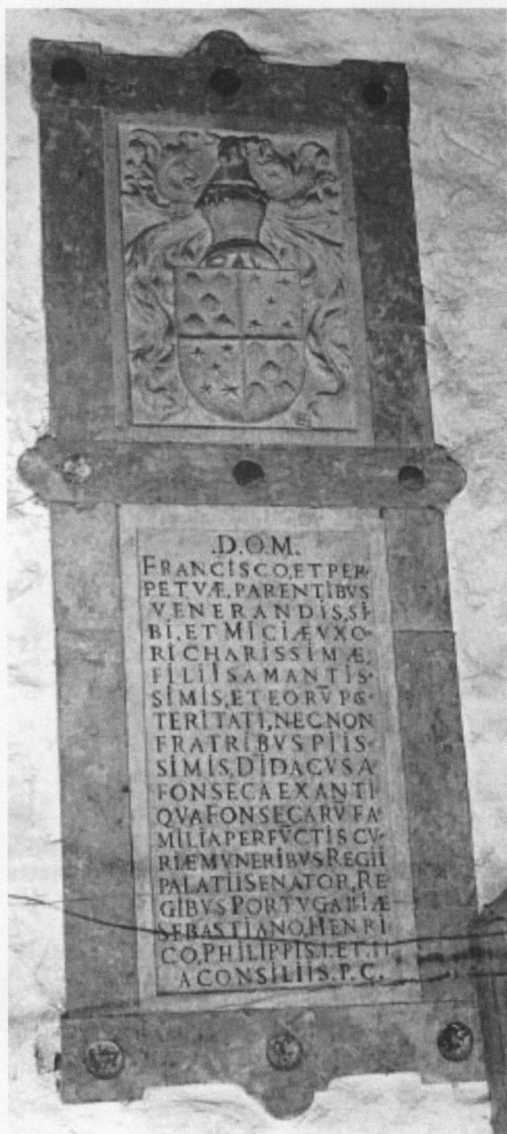
Inscrição nº 3