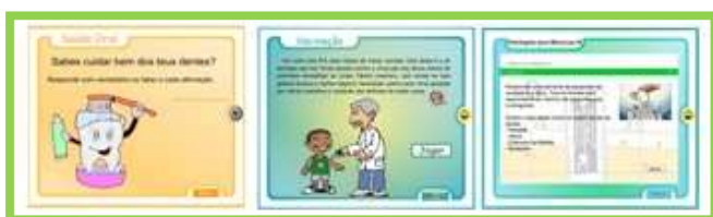
Figura 4 – Interfaces de jogo da aplicação Patologia para Menorcas

Depois da interface inicial, independentemente do jogo escolhido, é apresentada a sua explicação, como ilustram as imagens seguintes a título de exemplo (figuras 5, 6 e 7):