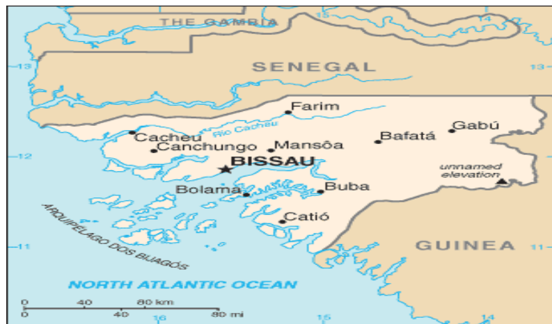
Mapa 1- Mapa da Guiné-Bissau