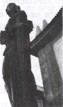
Figura 4 - A Justiça , 1969.

Em continuação, os participantes são convidados a desenvolver uma actividade experimental, ilustrativa do processo de oxidação dos metais (Anexo1), em que elaboram quadros/pinturas utilizando desperdícios de diferentes metais/objectos metálicos do dia-a-dia cujos produtos de corrosão apresentam diferentes cores, bem como metais/objectos metálicos que se mantêm visivelmente inalterados dada a sua baixa reactividade.