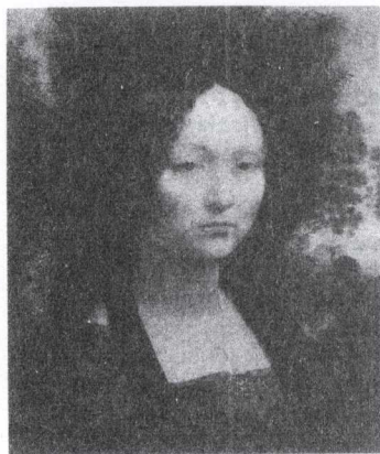
Figura 2 - Ginevra de Benci, 1474 .

É também conhecido o interesse da Ciência e da Tecnologia por questões que se prendem com o suporte material das obras de arte, nomeadamente o metal. Embora os efeitos da corrosão metálica sejam, em geral, prejudiciais, nalguns casos o aspecto resultante pode ser