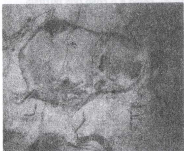
Figura 1 - Bisontes de Altamira .

Desde sempre, o conhecimento científico esteve ligado à arte de saber-fazer do artista. Na pintura rupestre, a forma dos Bisontes de Altamira (Fig.1) é perfeitamente identificada através da cor e em Ginevra de Benci (Fig.2), Leonardo da Vinci (1452-1519) dá uma coerência tonal ao primeiro plano e à paisagem de fundo, aplicando à pintura as suas investigações experimentais sobre as implicações da luz e da sombra na transformação das cores.