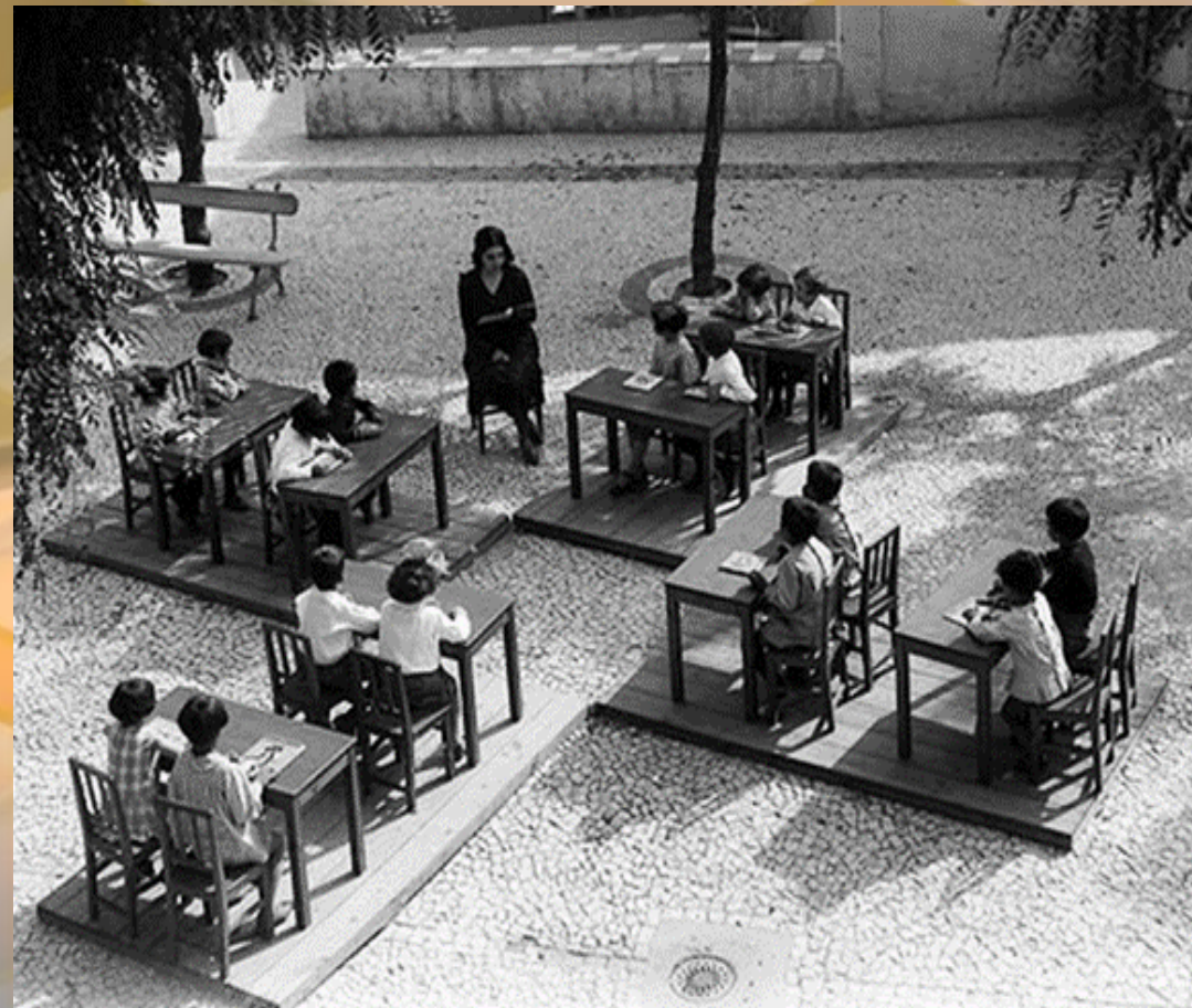
Figura : Sala de aula no Refúgio anexo à Tutoria Central da Infância (Lisboa) – em 1913?

http://restosdecoleccion.blogspot.pt/2012/06/ensino-primario.html