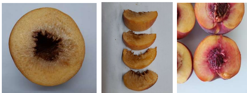
Figura 1.2 – Sintomas de dano por frio. A – polpa acastanhada; B – polpa farinhenta, cavernosa e descolorada; C – polpa com veios vermelhos.

De acordo com Lurie e Crisosto (2005), o aparecimento dos sintomas está dependente da temperatura e tempo de conservação, referindo que os sintomas podem ser visíveis num período de 1 a 2 semanas quando os frutos estão