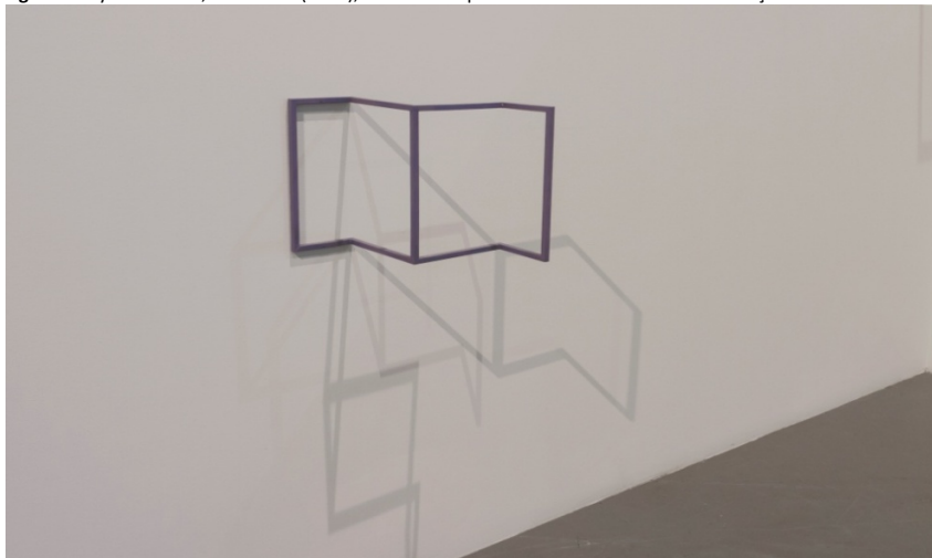
Fig. 4 – Pollyanna Freire, Sem título (Roxa), 2015. Latão pintado. Dim: 21 x 30 x 18 cm. Coleção de Mário Teixeira da Silva.

Fonte: Comunicação Pessoal a 22/03/2018.