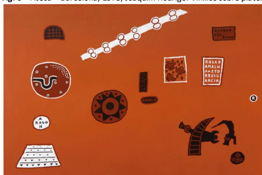
Fonte: Lapa, P., (1999), Catálogo Raisonné Joaquim Rodrigo , Lisboa, Instituto Português de Museus - Museu do Chiado, Nº 204.

Para o colecionador “o valor das coleções pode ser 0.” “Para mim, não me interessa se a coleção vale 10, 20 ou 30. O que me interessa é aquilo que eu tenho ou que eu gosto, e que eu lutei para as ter. Eu não estou a pensar em vender amanhã ou depois de amanhã. Até poderei ter necessidade disso. Mas não daria uma obra por 10 se eu ache-se que vale 30. Não vale a pena, fico com ela.”