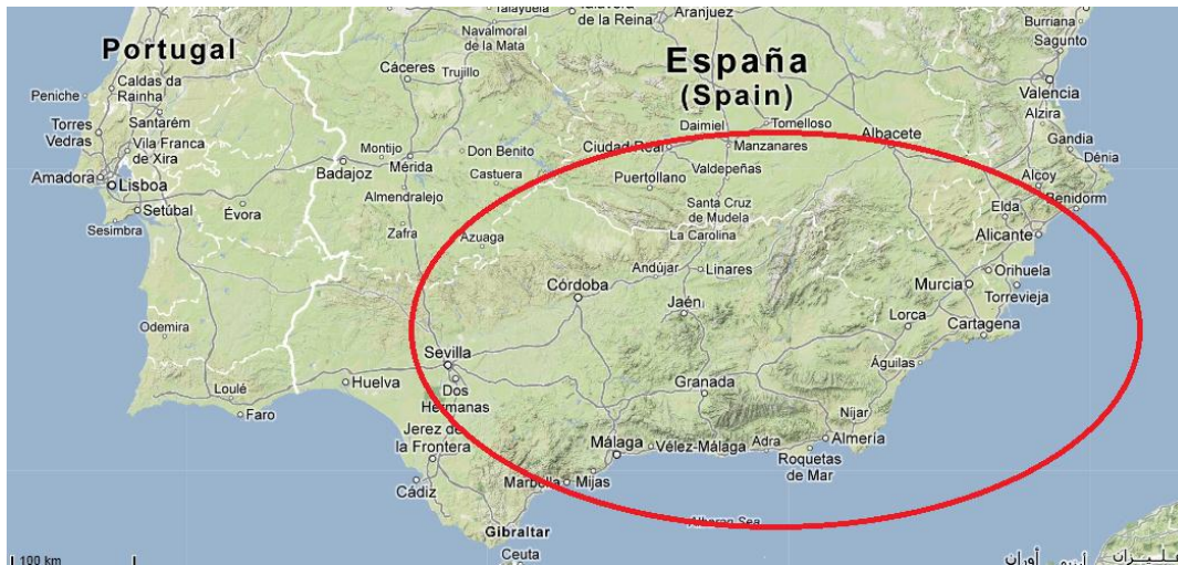
Figura 1 – Localización geográfica de la raza ovina Segureña.

Al estar explotada en condiciones extensivas y semiextensivas, es además, uno de los componentes del equilibrio del ecosistema de las regiones que habita, siendo por tanto un pilar básico de la sostenibilidad ambiental y social. La raza consigue, en estos ambiente tan duros y desfavorecidos, unos rendimientos muy interesantes.[1]