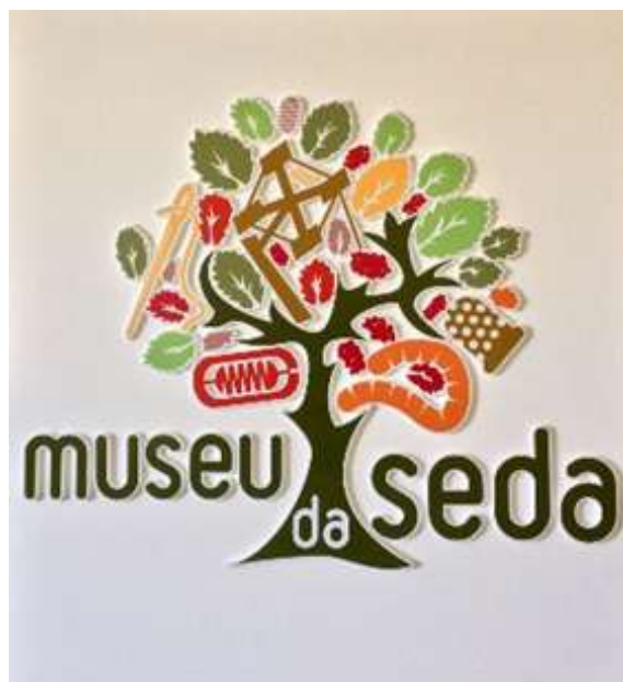
Figura 1. Logotipo do Museu da Seda

A sala dois "Sala dos Audiovisuais" é o espaço destinado à projeção de um pequeno filme sobre a produção da seda, as restantes salas denominam-se: Do Bicho ao Fio; Do Fio ao Tecido e do Tecido ao Produto Final. Nestes espaços pode compreender-se o processo de produção da seda, conhecer alguns instrumentos utilizados no método tradicional de obter a seda e apreciar alguns objetos de seda. A Figura 1 apresenta o logotipo do Museu da Seda da APPACDM de Castelo Branco (Portugal):