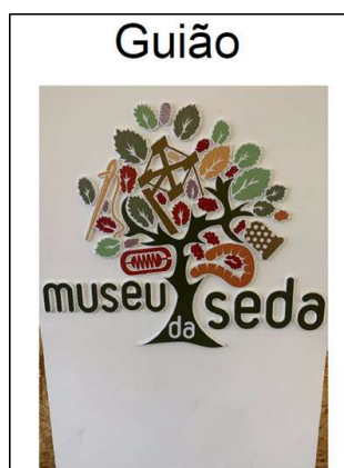
Figura 2. Guião

Após a adaptação dos textos, os mesmos foram validados por grupo de 20 jovens com deficiência intelectual e baixa literacia da APPACDM de Castelo Branco. Foram efetuadas as respetivas correções e posteriormente os textos foram impressos e encadernados. Ficando disponíveis no museu da Seda em formato impresso e digital. As Figuras 2 e 3 são um exemplo do trabalho final que foi obtido. A figura 2 representa a capa que se refere ao Guião e a Figura 3 apresenta um exemplo de um texto: