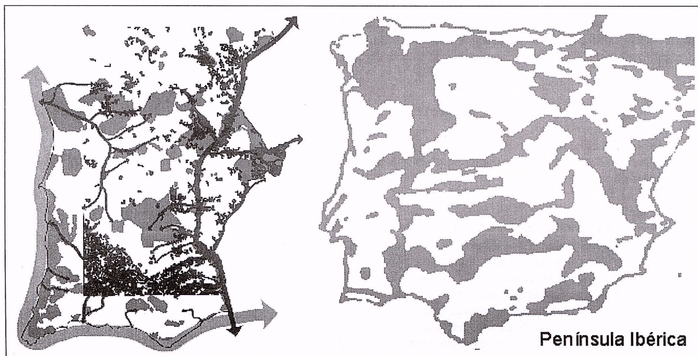
Figura 2 - a) Conjunto de alguns elementos da rede ecológica no SE alentejano. b) Extracto da proposta da Estrutura Ecológica Principal da Comunidade Europeia (Bischoff & Joungman,

unidade, permitiu não só a identificação do grau de estabilidade dessa unidade, como a identificação da sua complementaridade relativa. Esta última informação provou-se particularmente importante na justificação dos resultados da avaliação no terreno, da produtividade ecológica dos principais grupos faunísticos nas diferentes formações cartografadas (Tabela 6), assim como na estimativa do valor genético dessas formações. Esta caracterização é crucial na calibração dos métodos de