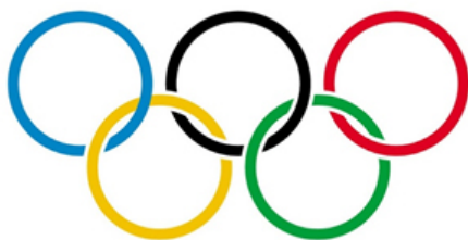
Fig. 3 – Símbolo dos Jogos Olímpicos.

Para que a identidade seja durável, e facilmente reconhecida ela precisa conter poucos elementos, para que esse reconhecimento se torne mais fácil. Uma das marcas mais impactantes e antigas da história do design de identidades, o símbolo dos jogos olímpicos (figura 03) é um caso de simplicidade evidente, são apenas círculos sobrepostos com cores diferentes, mas mesmo assim é reconhecida pelo mundo todo.