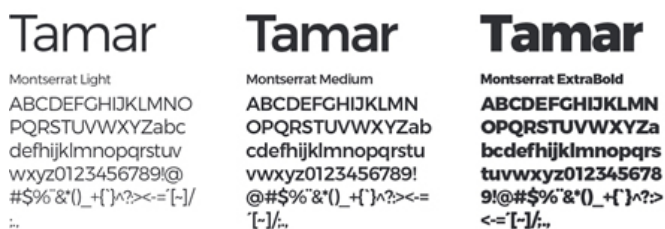
Fig. 11 – Estudo de tipografia.

A família tipográfica escolhida foi a Montserrat, como pode ser visto na figura 11, pois apresenta aspectos modernos, é um tipo linear, legível. Essa família também apresenta várias opções de peso, variando do extra light até o black, o que permite uma maior variação de peças gráficas.