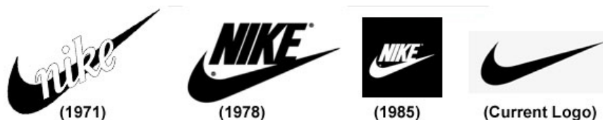
Fig. 4 – Evolução da marca Nike.

Manter uma ideia e um conceito principal durante anos ajuda à marca a ser atemporal. A empresa de artigos esportivos Nike, fundada em 1971, utiliza do mesmo conceito desde sua criação. O símbolo swoosh foi criado para dar sensação de movimento, como podemos perceber na figura 04. Atualmente a Nike é uma das empresas de maior valor do mundo, e sua marca é reconhecida em todo o mundo.