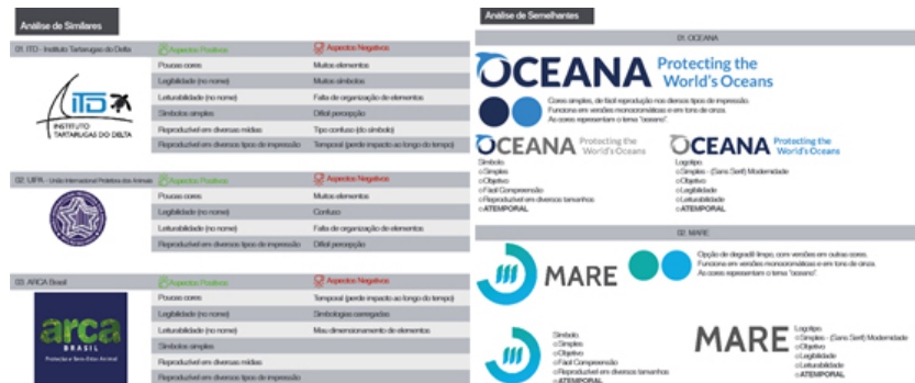
Fig. 9 – Análise de Similares e de semelhantes.

Citados no briefing, são três concorrentes, que foram devidamente analisados de acordo com os parâmetros do caráter atemporal. Além deste estudo foram selecionados dois projetos semelhantes, para serem analisados e servirem de exemplo para o projeto, as duas análises podem ser vistas na figura 09.