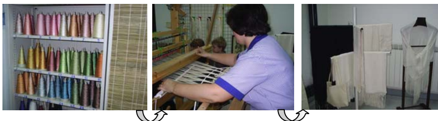
Imagem 4 – ... e do fio de seda ao produto final: xailes e outros acessórios 100% seda!