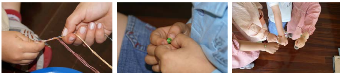
Imagem 7 – A interajuda adulto/criança e a persistência das crianças resultou no orgulho e na alegria da realização das “obras de arte”:

A sequência fotográfica seguinte ilustra as etapas envolvidas na produção de uma pulseira ... uma obra arte .