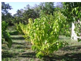
Imagem 1 – No pomar de amoreiras, as crianças exploraram o alimento do bicho-da-seda (cor, textura, odor, ...)

Esta visita permitiu às crianças, além da descoberta da seda, o contacto/interacção com jovens portadores de deficiência mental o que, esperamos, contribua para a sua sensibilização para a diferença. Ao mesmo tempo, as crianças puderam recolher algum material indispensável à realização das actividades práticas na sala de aula.