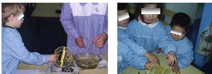
Imagem 6 – A forma como as crianças substituíram a dobadoira

Depois de alguma discussão, e do lembrar da visita de estudo, as crianças acordaram em utilizar uma “ rodinha da gaiola do meu hamster ” em substituição da dobadoira.