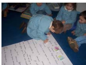
Imagem 5 – Na construção colectiva do pictograma foi evidente a motivação e o empenho das crianças

Já na sala de aula as crianças relataram, umas às outras, as suas opiniões e após um registo individual da visita construíram, colectivamente, um registo pictográfico. Foi gratificante observarmos a forma empenhada e espontânea com que as crianças aderiram a estas actividades.