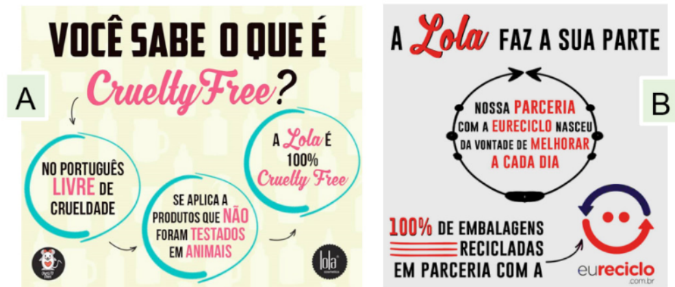
Fig. 3 Continuamente, é também anunciado pelos emissores da marca que há um rígido controle para a economia no uso de embalagens, incluindo a logística reversa para a coleta e a reciclagem de material, sendo que isso justificou a concessão de uso do selo Eureciclo (Fig. 3B).

Com relação ao posicionamento responsável e integrado às demandas socioambientais, os emissores da marca afirmam que os produtos representados são produzidos sem testes em animais, confirmando a postura internacionalmente reconhecida como crueltyfree (Fig. 3).