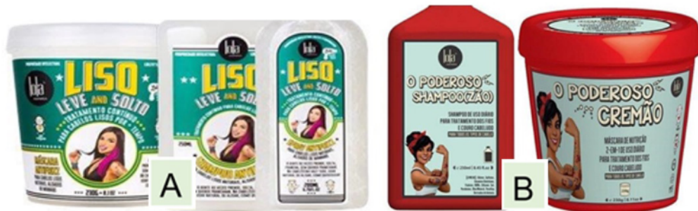
Fig. 4 Produtos Lola: (A) “Livre, Leve e Solto”; (B) “Poderoso Shampoo(zão)” e “Poderoso Cremão”.

Ao inserir os “chavões” da cultura cinematográfica e astrologia na comunicação da marca, como também fazem com outros lugares-comuns da moderna indústria cultural, os gestores de Lola Cosmetics renovam o contexto de aplicação dessas ideias. E, de maneira irônica e bem-humorada, aproveitam e incorporam a popularidade dos “chavões” à cultura da