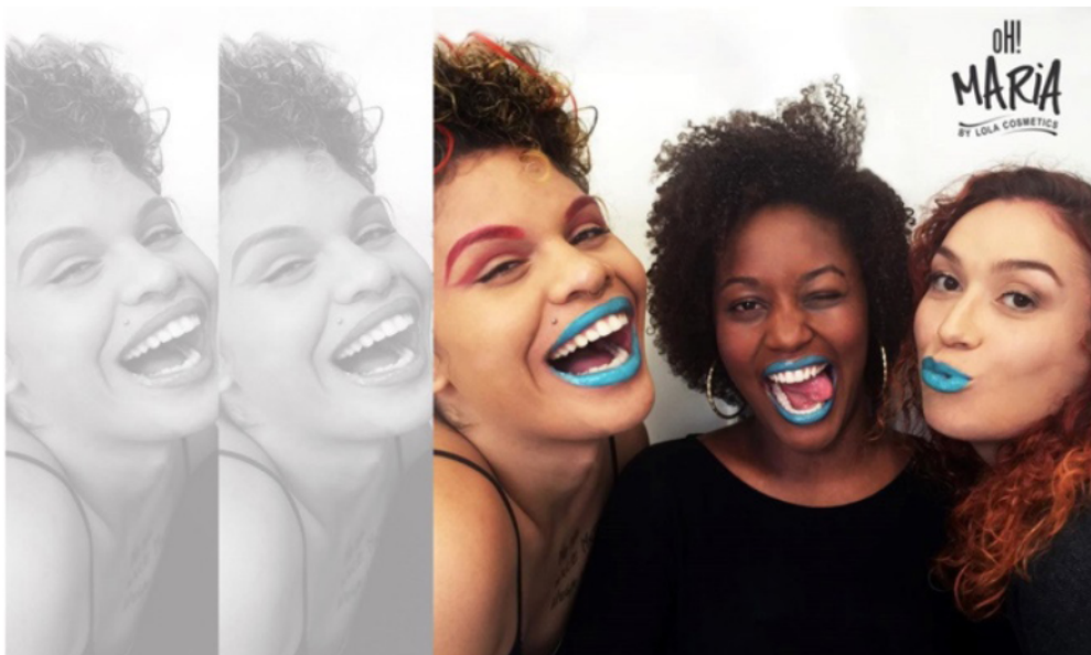
Fig. 2 Diversidade étnico-racial, sexualidade e gênero na campanha de 2015 Lola Cosmetics.

De maneira pioneira no mercado nacional, os emissores da marca adotaram como diferencial comunicativo a ironia e o humor na designação de suas linhas de produtos. 1 Tudo indica que