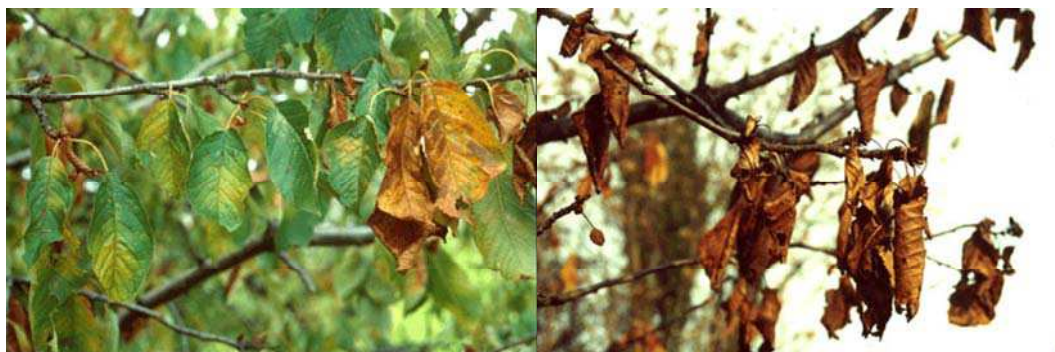
Figura 3 – Dois aspectos do ataque e da desfoliação provocados por Apiognomonina erythrostroma em cerejeira.

O cancro de Cystopora leucostoma tem sido uma doença confundida com o cancro bacteriano, causado por Pseudomonas syringae , embora o aparecimento do sintoma de gomose seja muito mais abundante nesta última. C. leucostoma aparece frequentemente em cerejeira e em ameixeira posteriormente ao ataque de P. syringae , sendo esta considerada uma doença precursora. No entanto, principalmente em cerejeira, o cancro bacteriano é uma doença muito mais grave e frequente. O combate a C. leucostoma terá que ser realizado através de práticas culturais, nomeadamente com podas sanitárias dos ramos afectados. O diagnóstico atempado desta doença é fundamental para tomada de decisão em relação aos meios de luta.