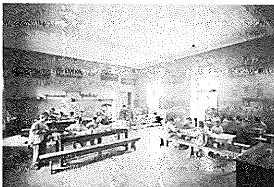
Foto 5: Aprendizagem profissional na oficina de carpintaria no Refúgio anexo à Tutoria Central da Infância-Lisboa (S/ data-1912?