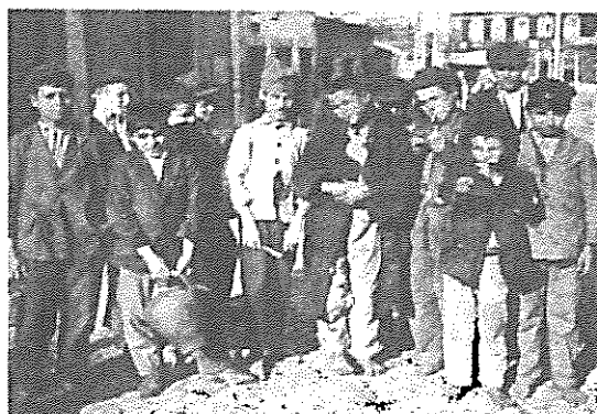
Foto 2: Bando de rapazes vadios, muitos deles abandonados pela família fazendo alguns fretes/trabalhos para sobreviverem. As taxas de analfabetismo infantil entre os 7 aos 14 anos eram elevadas. Clichê do negativo (S/d data, identificação do fotógrafo, p&b)