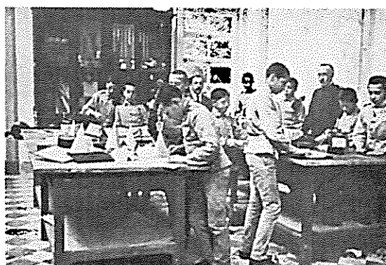
Foto 6: Alunos do Colégio Militar na oficina — aprendendo a executar trabalhos manuais em cartão.