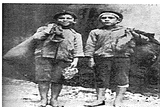
Foto 1: Crianças da rua, descalças, em calções, com sacos (trapalhos) de recolha de coisas para comercializar, com diadema de fita no cabelo e boné, no século XIX (s/d, 1903 ou 1905?, identificação do fotógrafo, p&b, de 13X18cm).

situações irregulares, esboça um corpus de ideias de infância objeto, objeto de intervenção, de direitos dada a incapacidade de responder pelos seus atos ou suprir certas condições sociais e, assim, o Estado, com o patronato e o sistema tutelar (Lei de Proteção à Infância, criada a 27 de maio de 1911, seguida da legislação de 1919, 1925, 1962, 1977, etc.), com os serviços jurisdicionais de menores, onde se destaca a ação das Tutorias de Infância (depois tribunais de menores em 1925), os Refúgios anexos e as instituições específicas (escolas de reforma, reformatórios, colônias agrícolas, etc.), que passaram a ser os responsáveis de intervir e decidir sobre a situação e vida desses menores vulneráveis, expostos a circunstâncias e ambientes de perigo moral ou em risco (moral e físico) (FIG. 1).